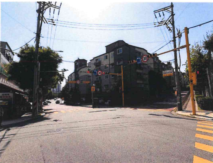
본건 북서측에서 촬영