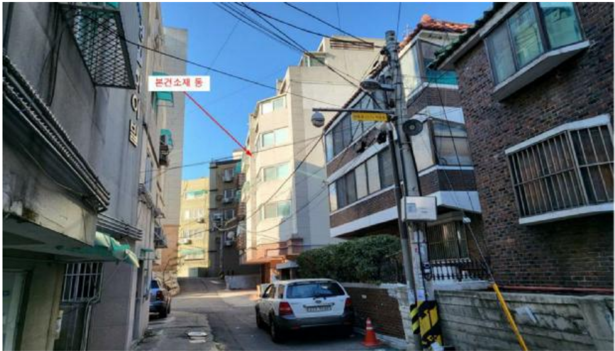
본 건 주 위