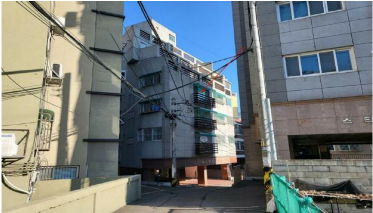
본 건 전 경