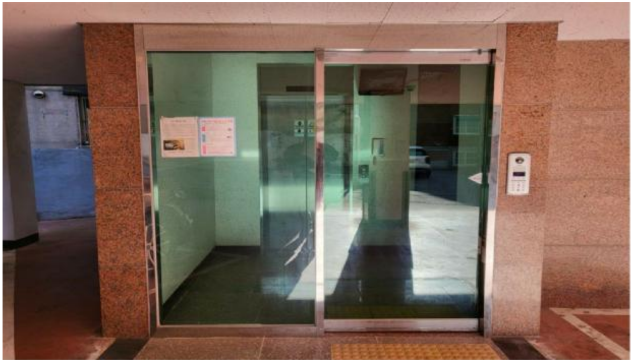
본 건 출 입 구