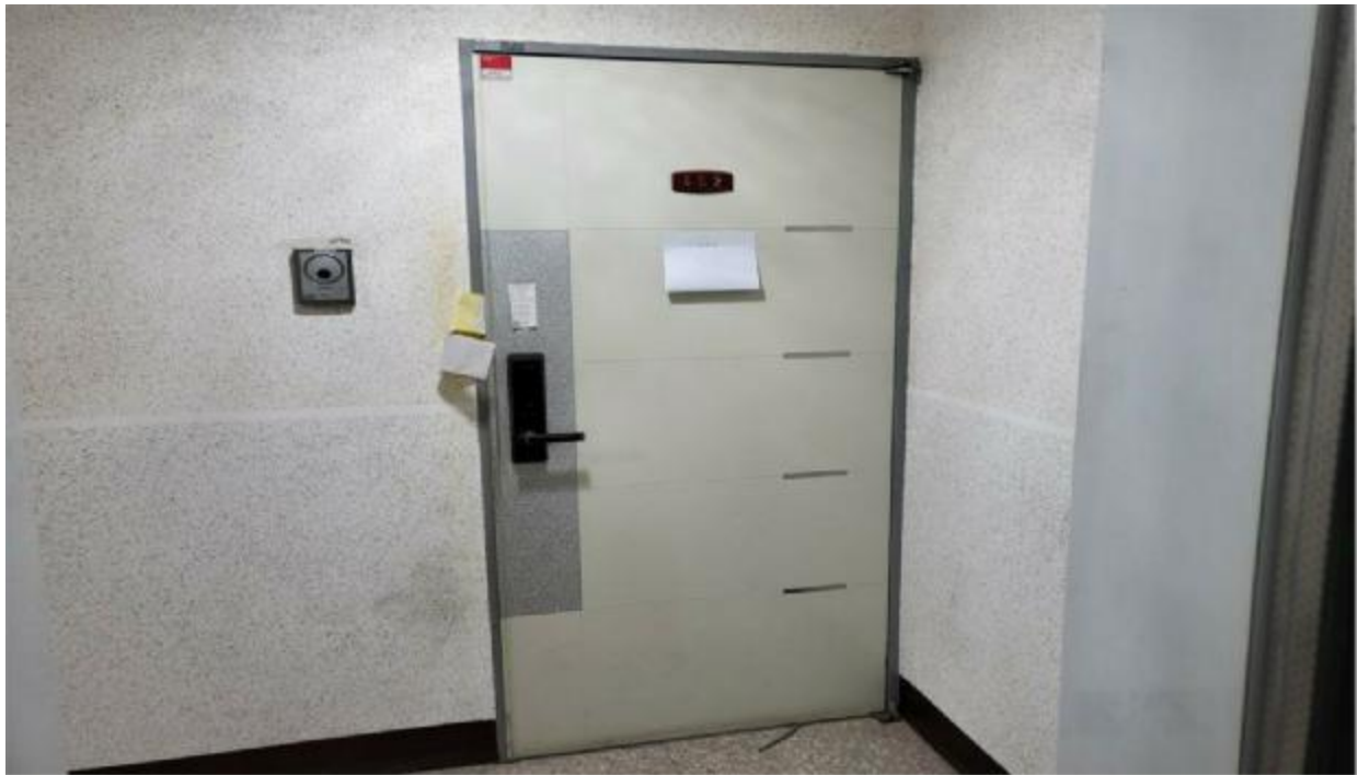
본 건 현 관