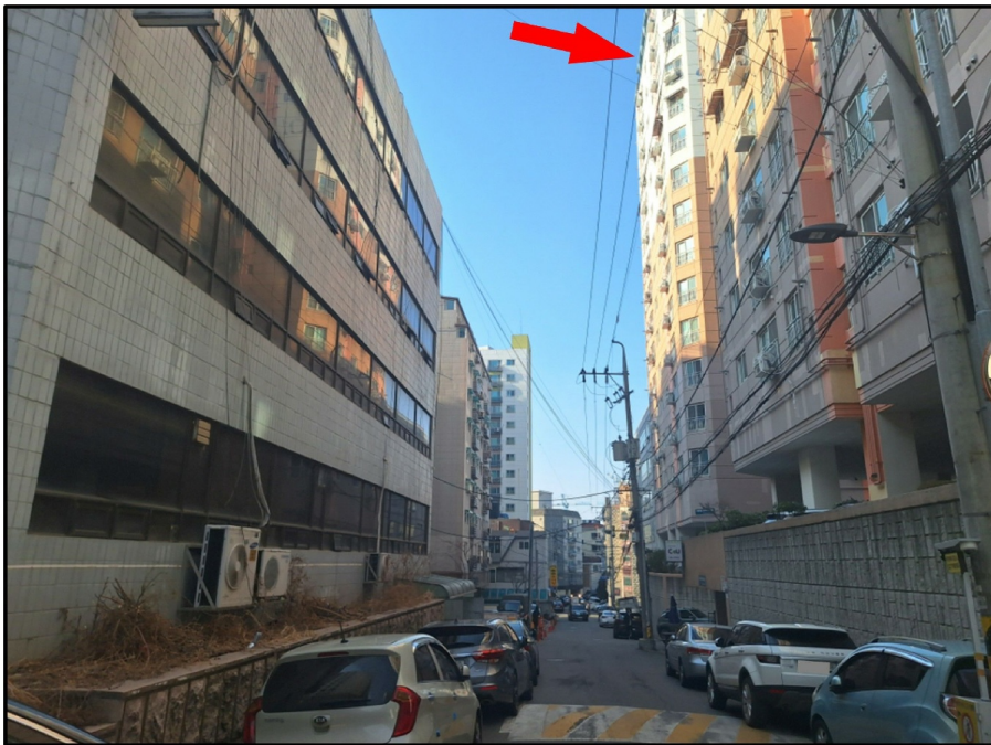
[ ( ) - ]