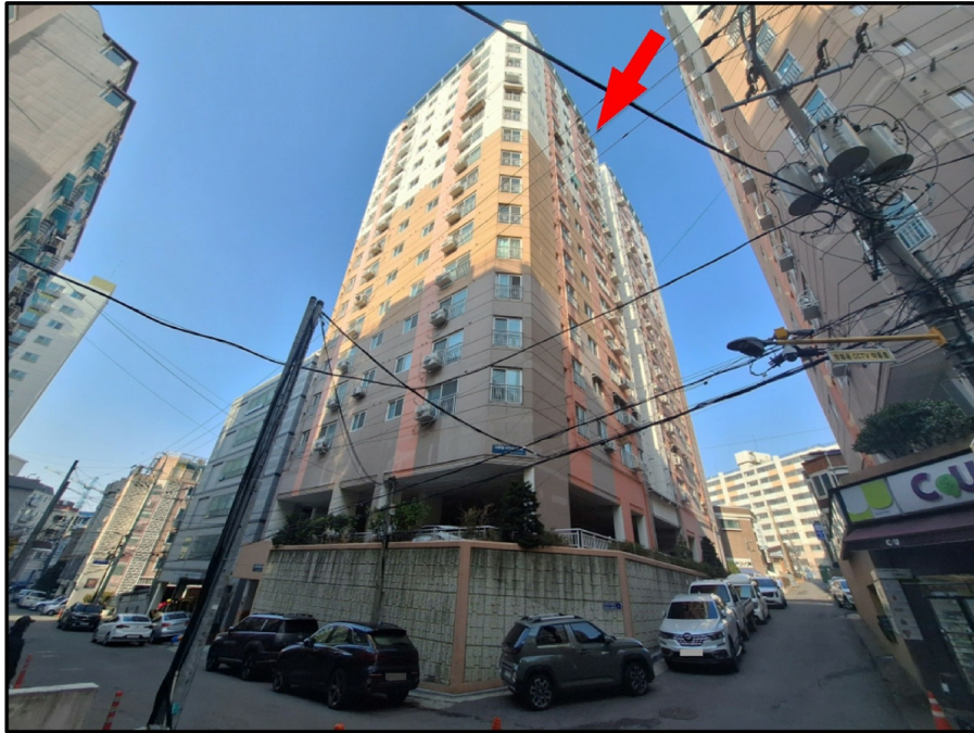
[ - ]