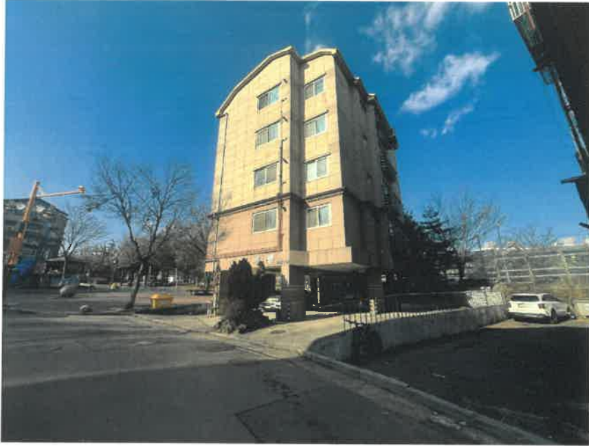
[ 본 건 전 경 ]