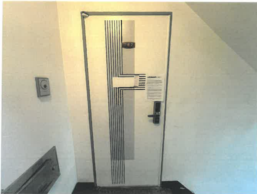
[ 본 건 현 관 ]