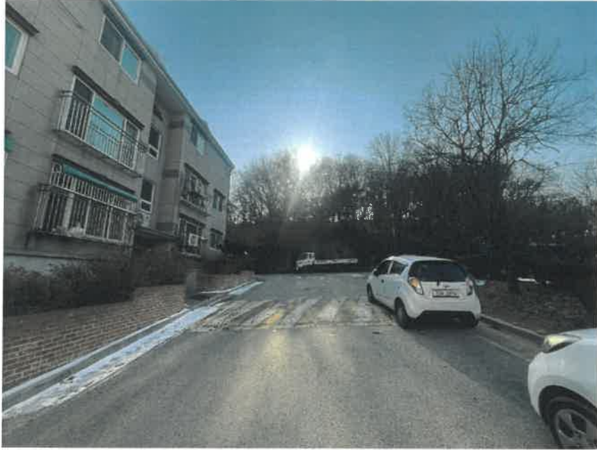
[ 주 위 환 경 ]