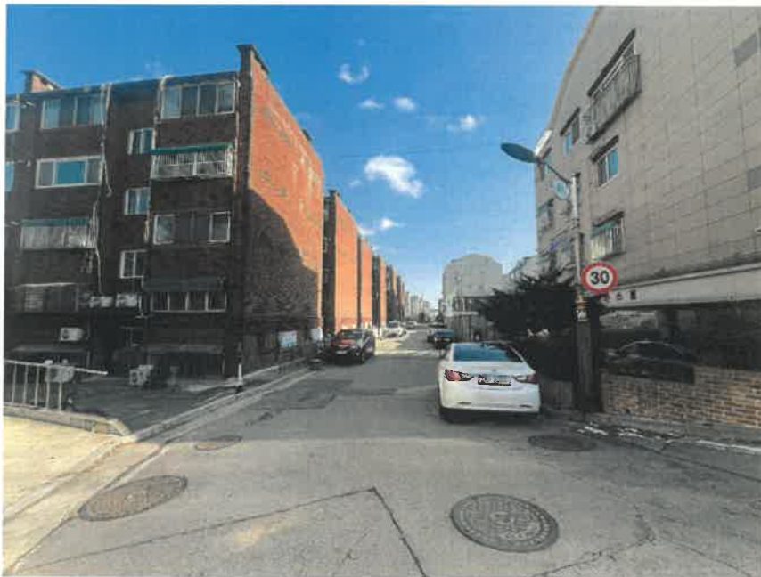
[ 주 위 환 경 ]