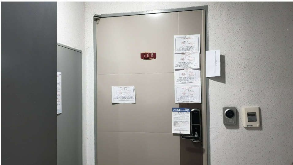
( 708 )