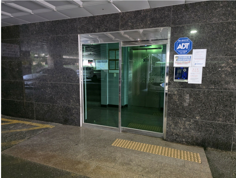
공 동 현 관