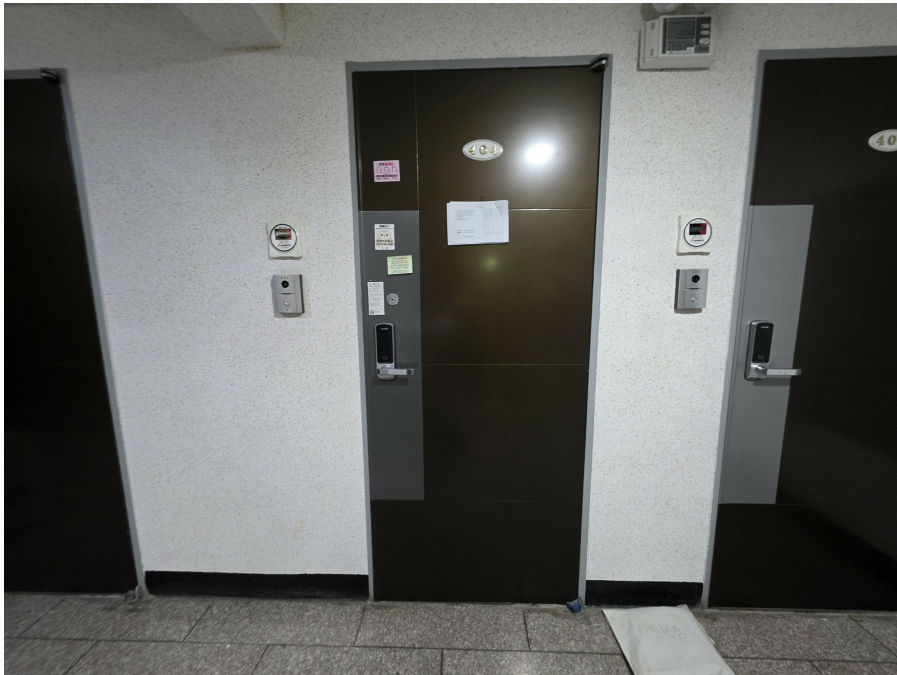
본 건 현 관