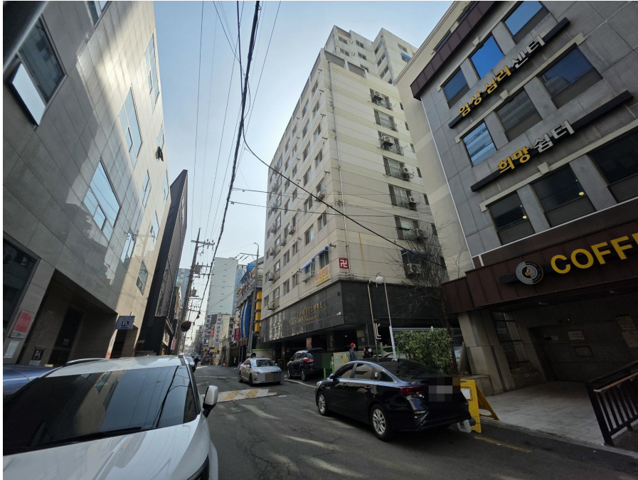
본 건 전 경