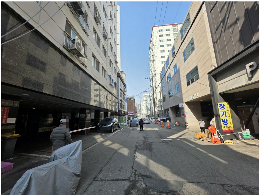
인 접 도 로