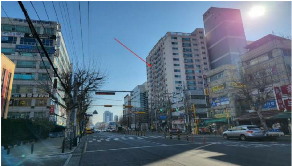
본 건 주 위