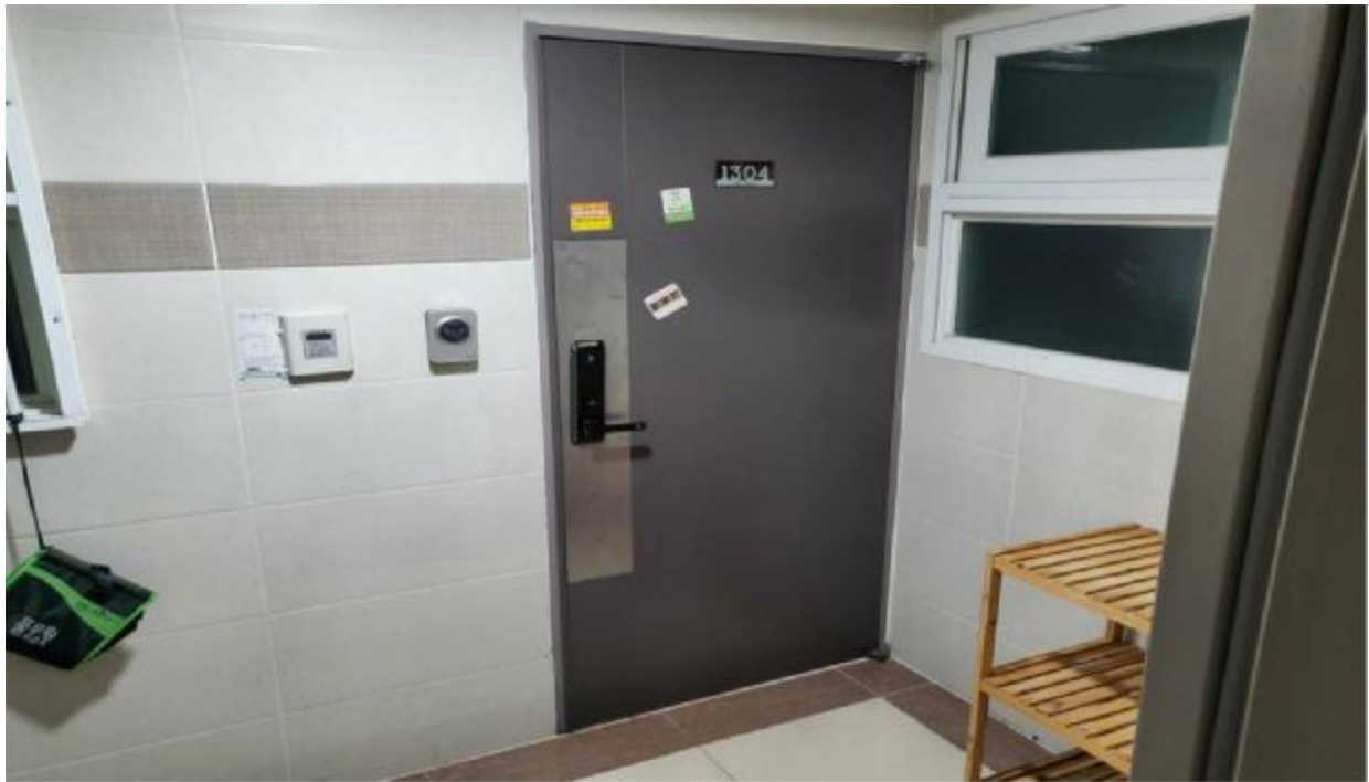
본 건 현 관