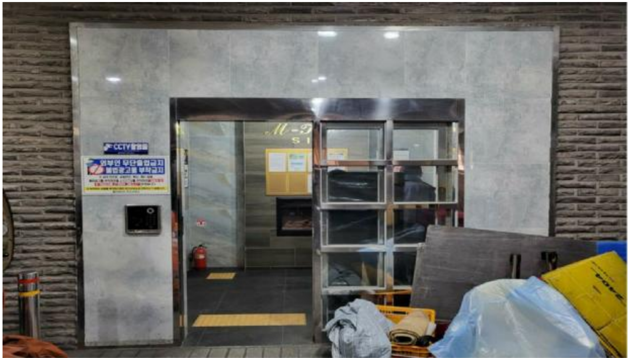
본 건 출입 구