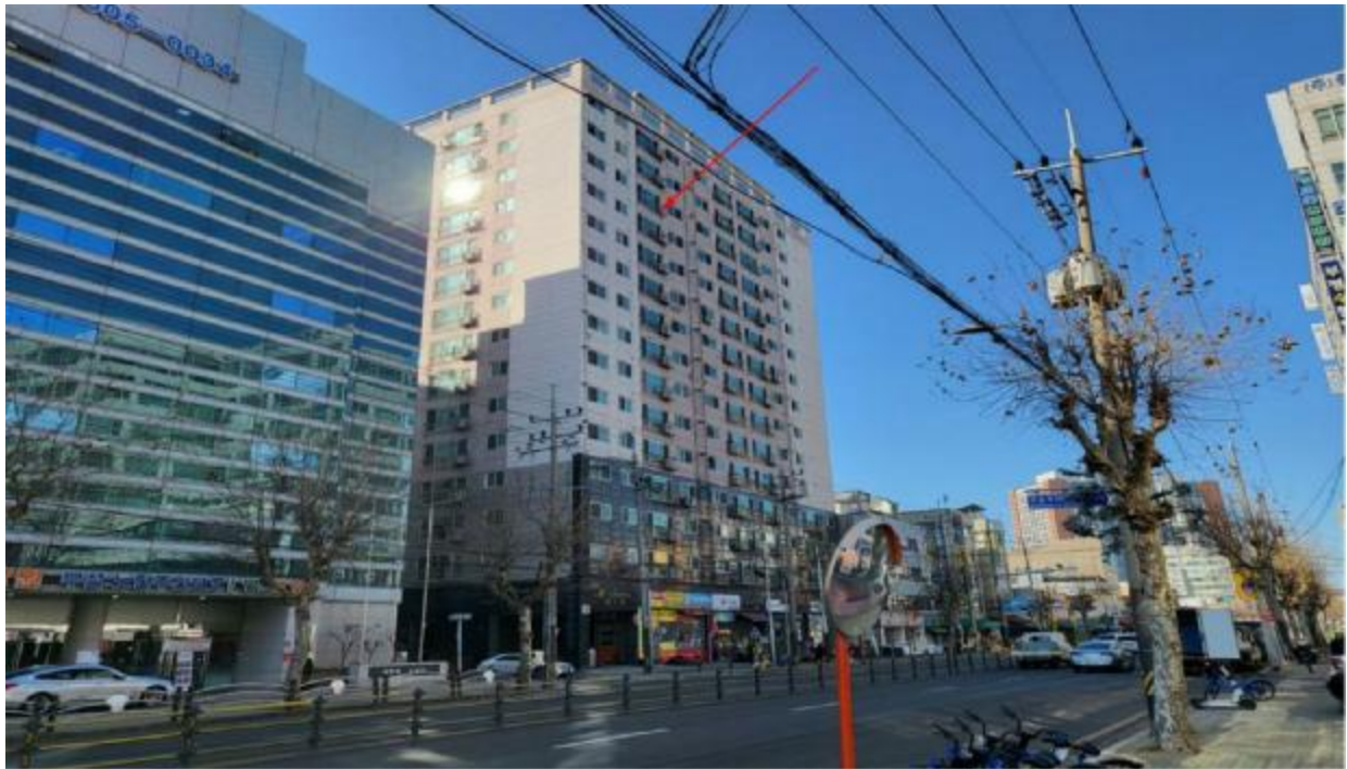
본 건 전 경