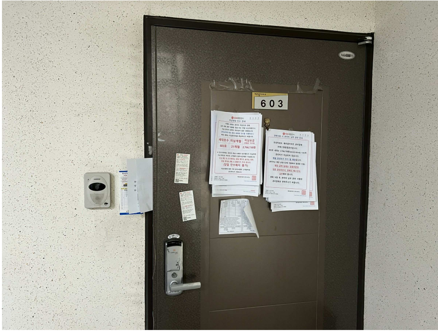
본건 외부 현황