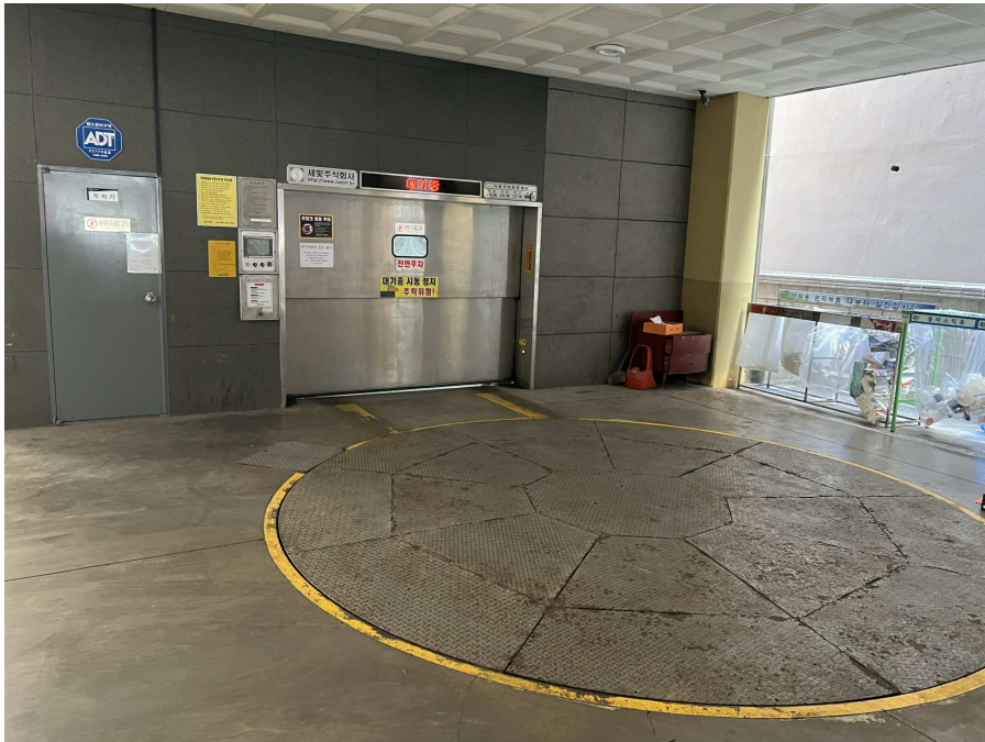
기계식 주차설비 부분