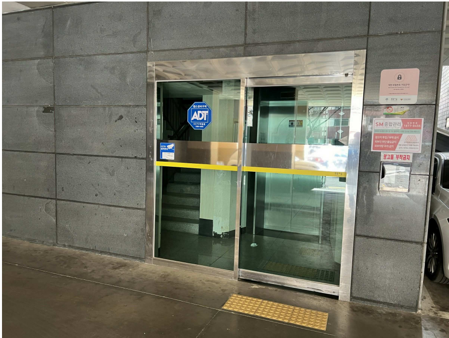
1층 출입부 현황