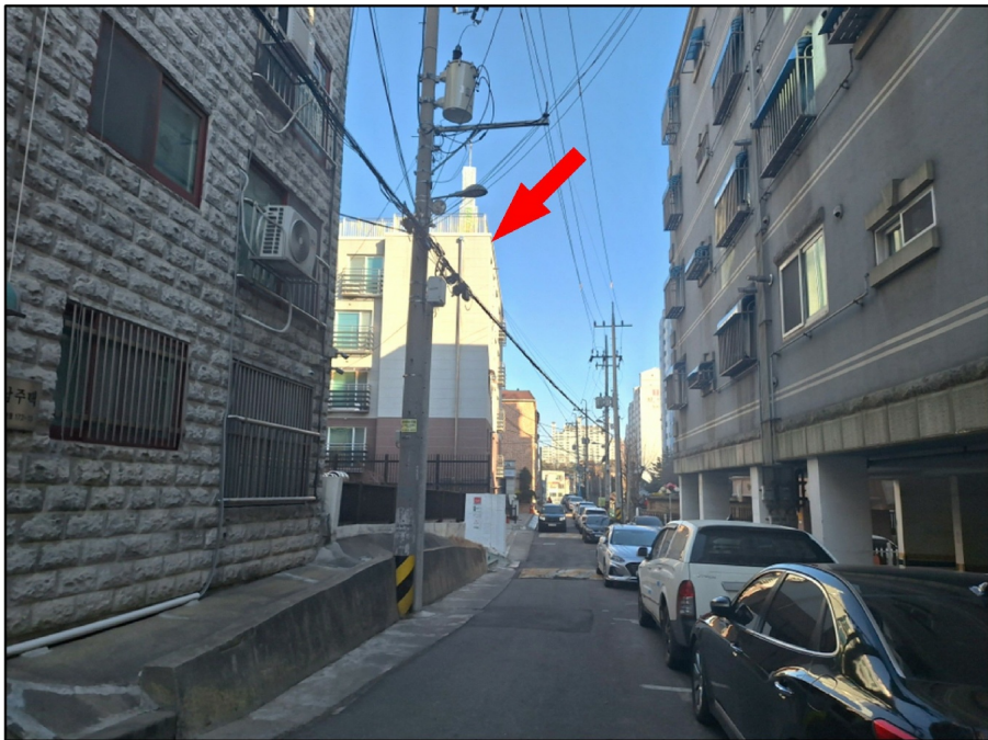
[ ( ) - ]