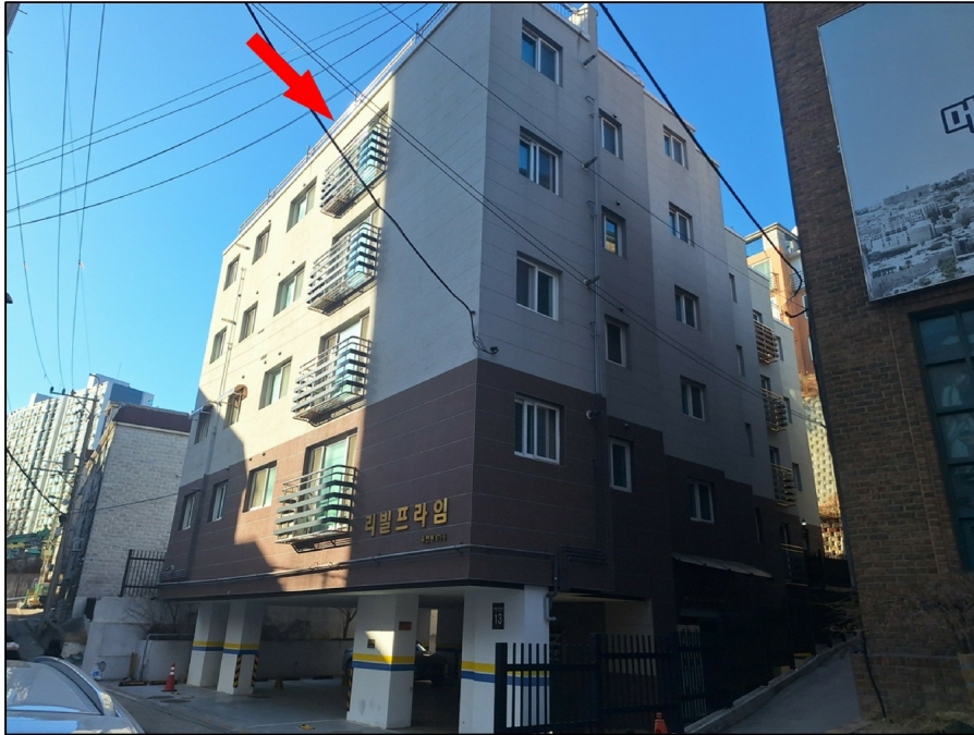
[ - ]