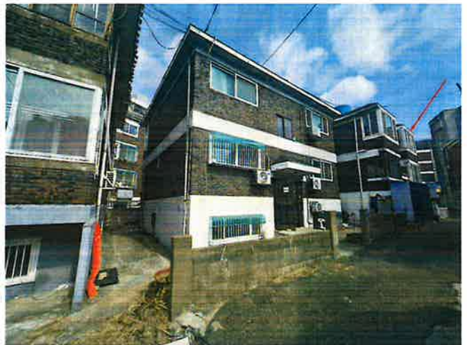
본건 단지 전경