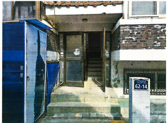
본건 공동출입구 전경