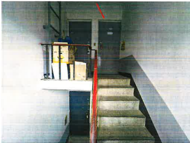
본건 복도 및 현관 전경