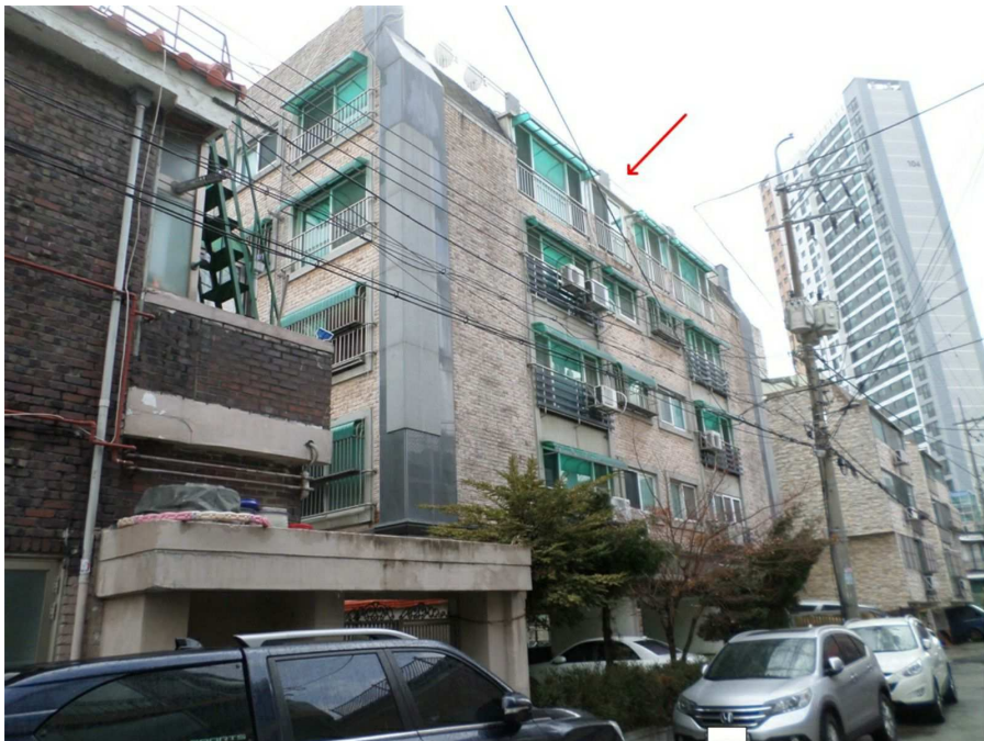
본건이 속한 건물의 전경