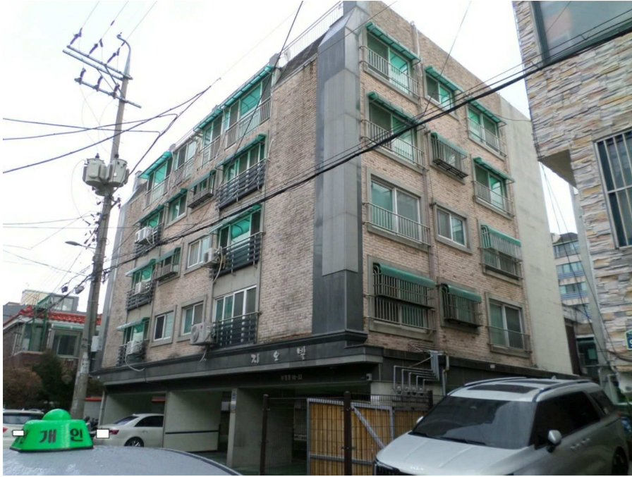
본건이 속한 건물의 전경