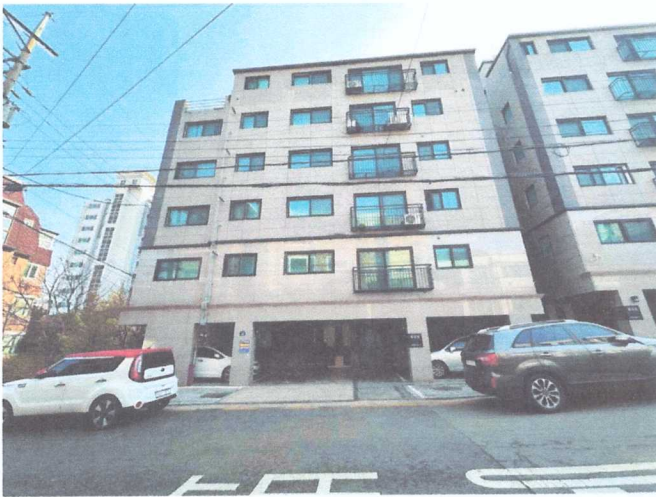
본건 소재 건물 전경