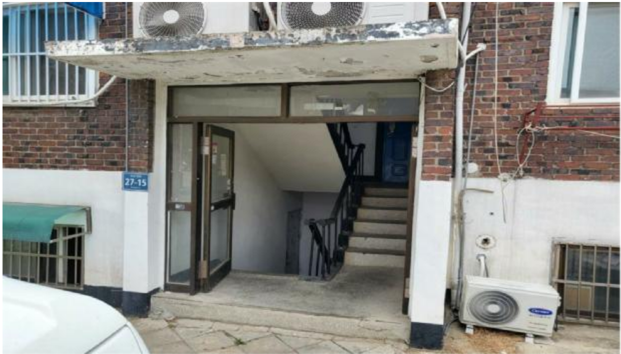
본 건 출입 구(1층)