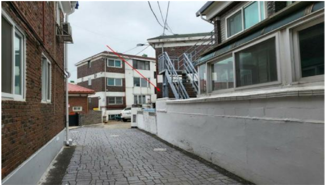
본 건 주 위