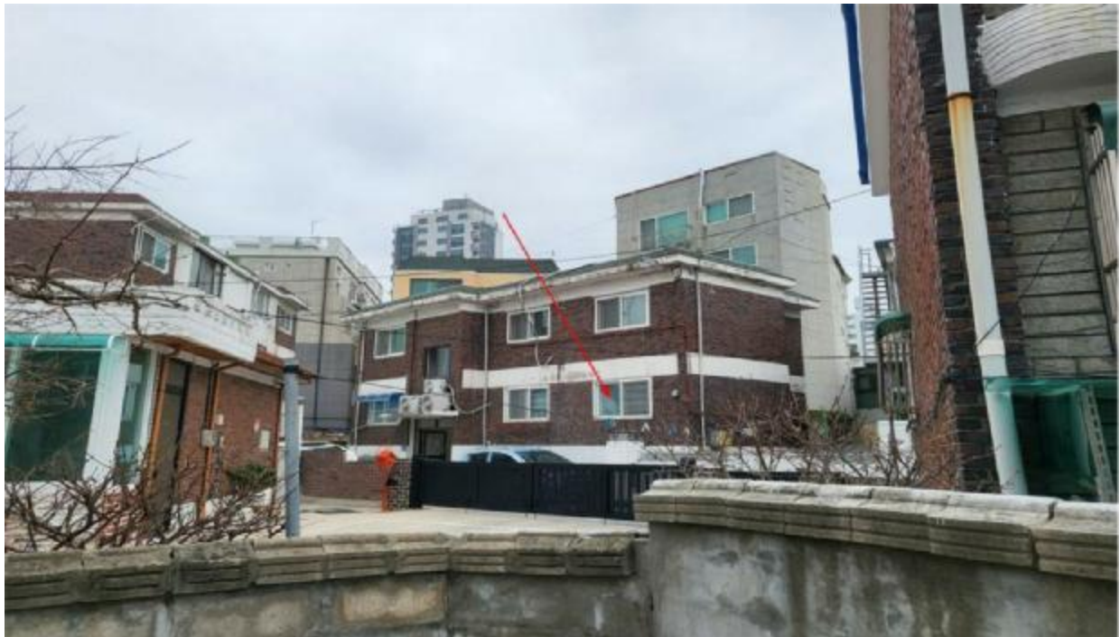
본 건 전 경