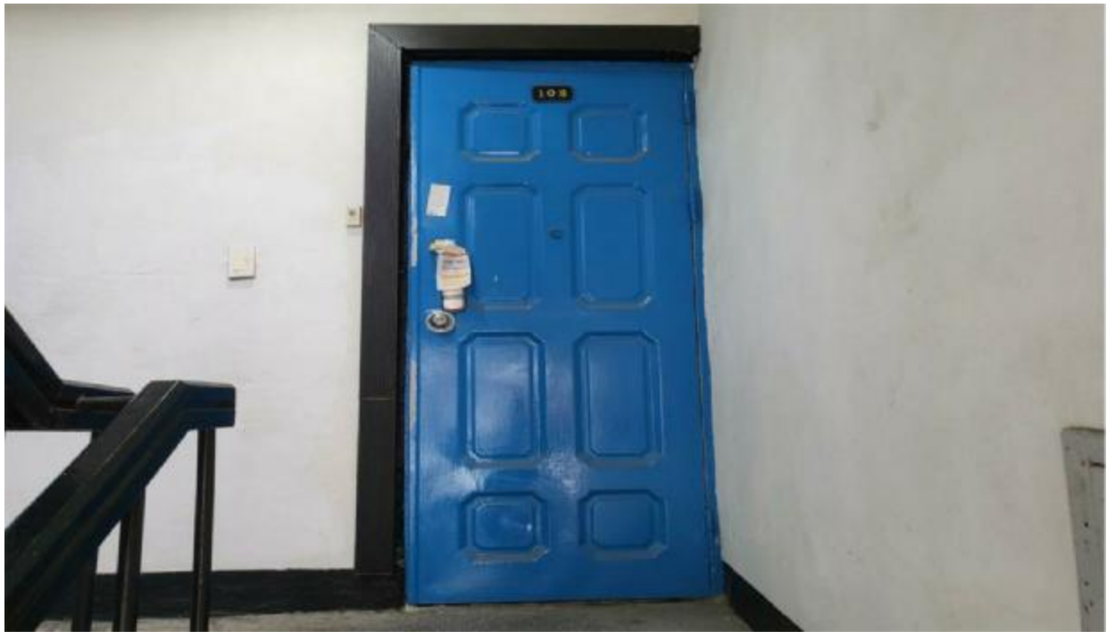
본 건 현 관