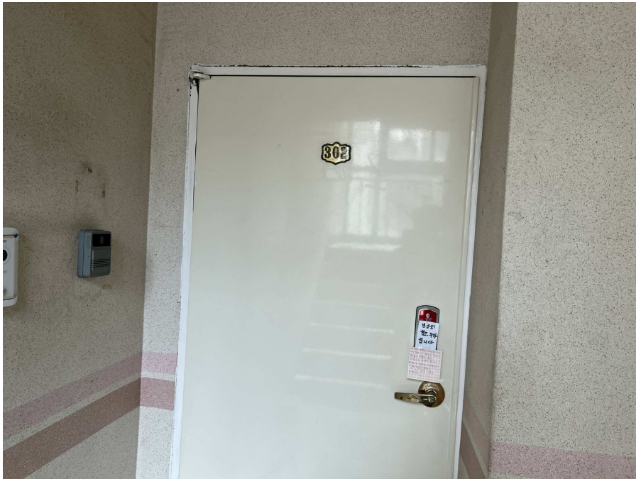
본건 외부 현황