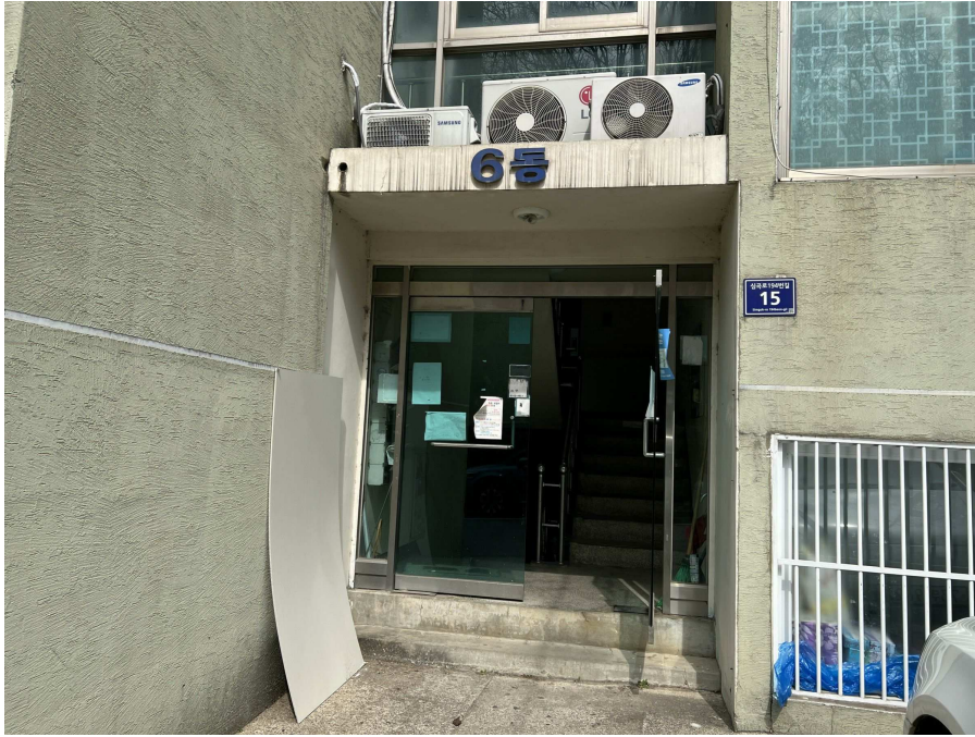
1층 출입부 부분