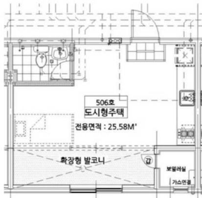
< 내부구조도 >