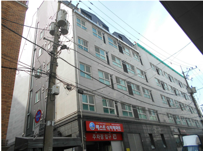
본건 전경1(북동측 인근에서 촬영)