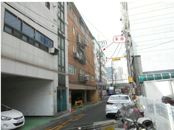
주변 전경(북동측 인근에서 촬영)