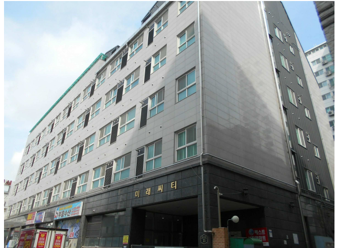
본건 전경2(남동측 인근에서 촬영)