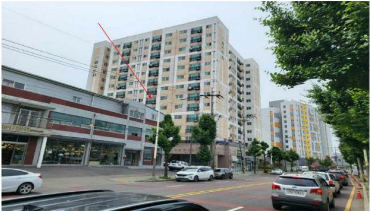
본 건 전 경