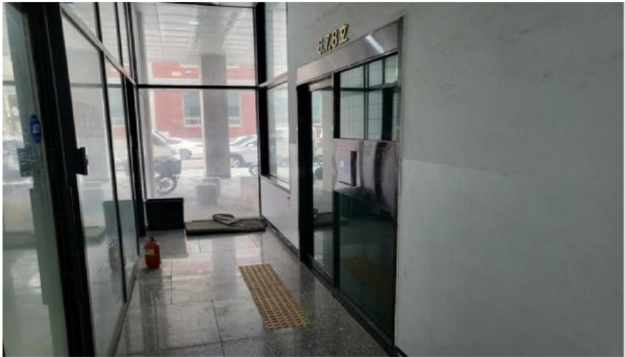
본 건 출입 구(1층)