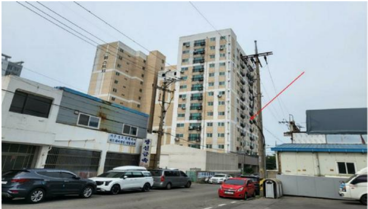
본 건 전 경