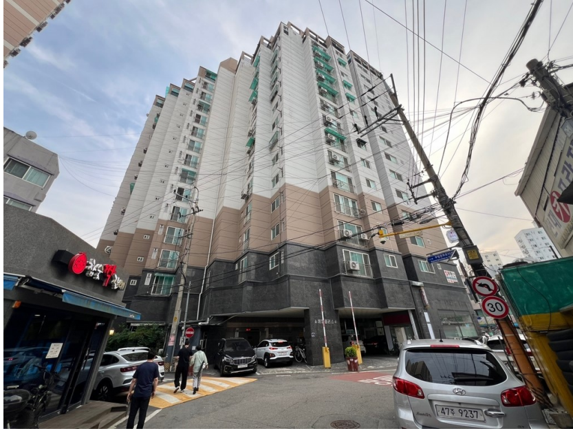
[ 대상물건 건물 전경 ]