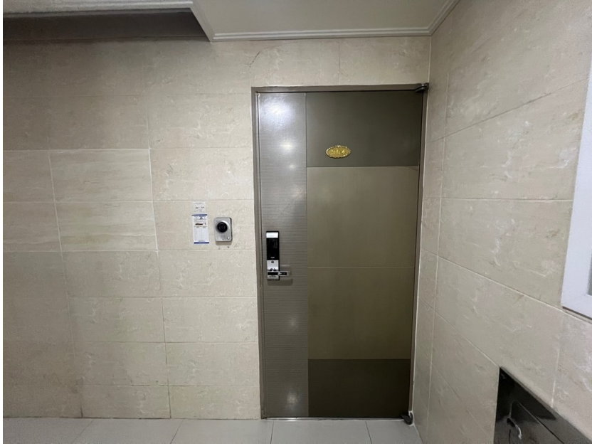
[ 대상물건 출입문 전경 ]