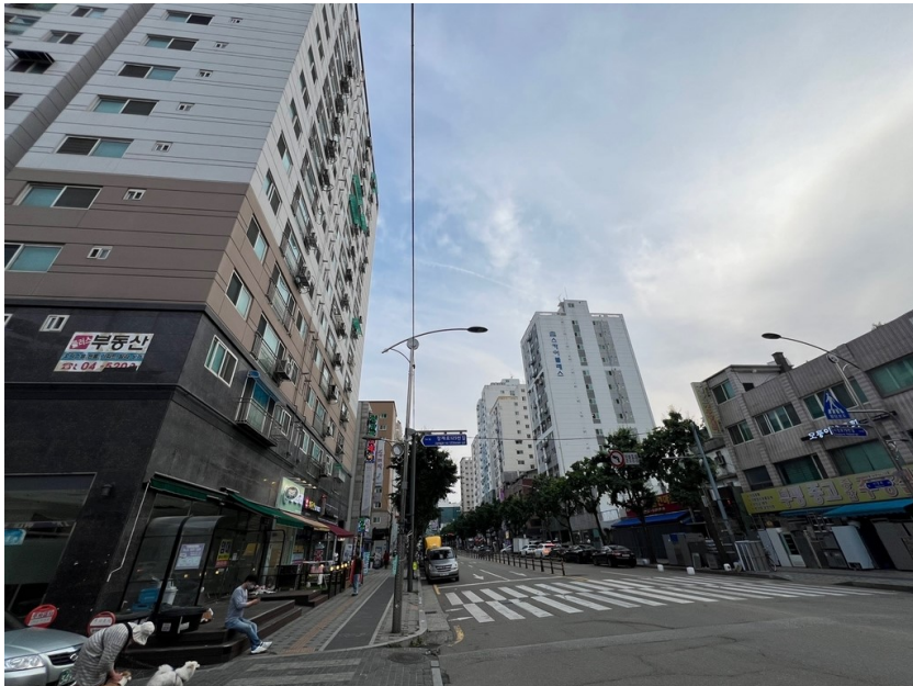
[ 대상물건 주위 전경 ]