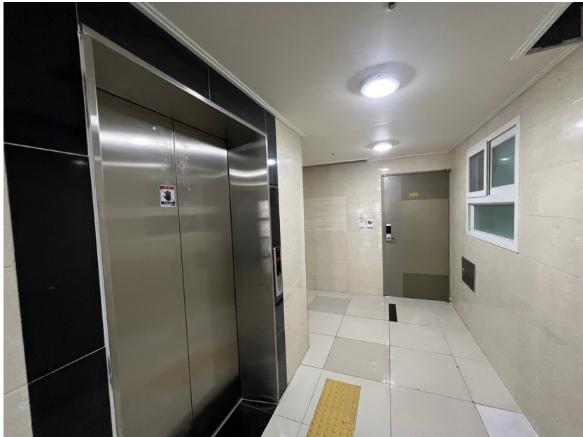
[ 대상물건 복도 전경 ]