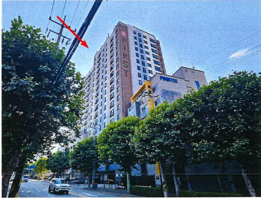
본건이 속한 건물의 전경