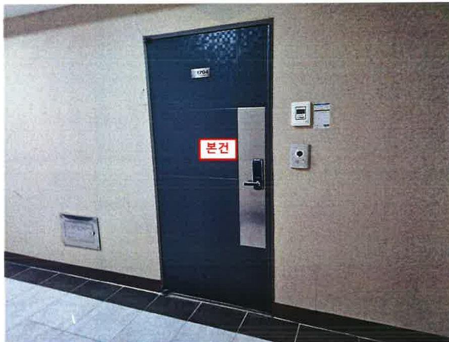
본건 현관문 전경