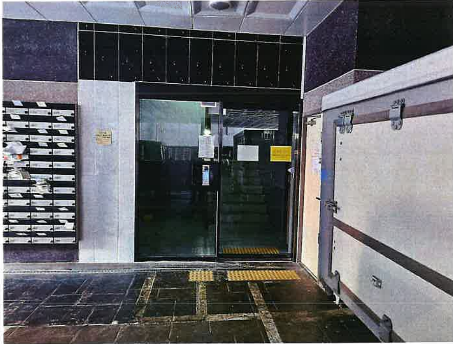
본건 주출입구 전경