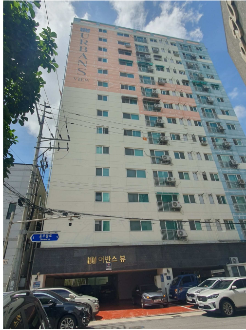
본건 소재 건물 전경