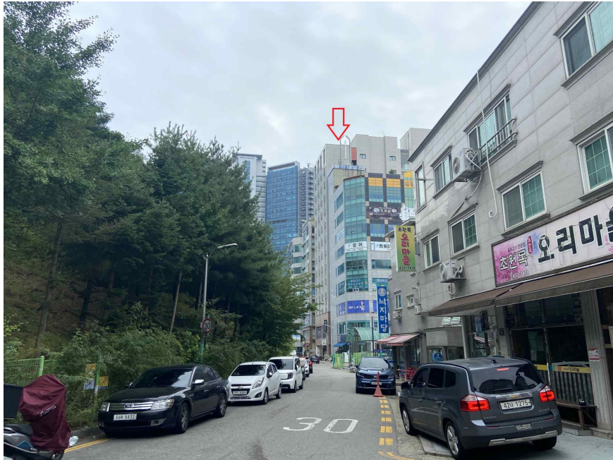
주위환경 (북측에서 촬영)