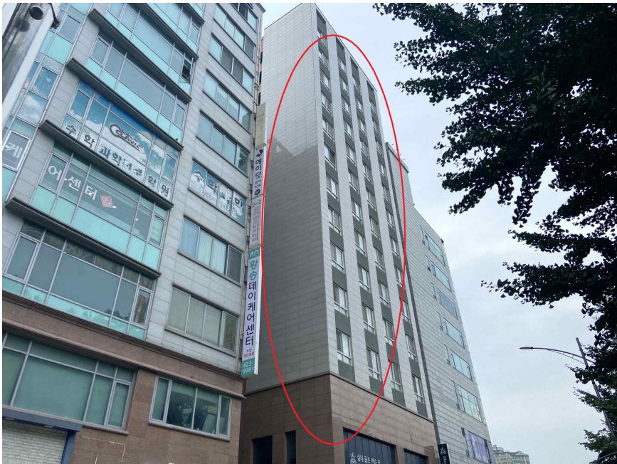
대상물건 소재 건물 (남동측에서 촬영)