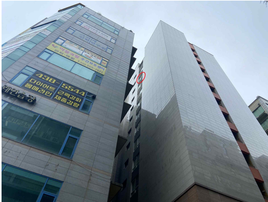
대상물건 전경 (북서측에서 촬영)