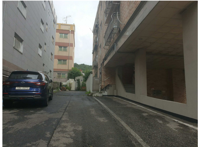
서측 접면 도로