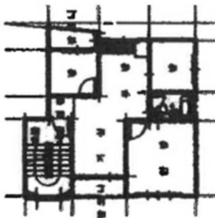
< 202호 내부구조도 >