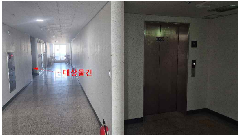
대상물건 내부전경[복도에서 촬영]