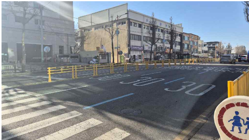
대상물건 주변전경[북동측 도로전경]