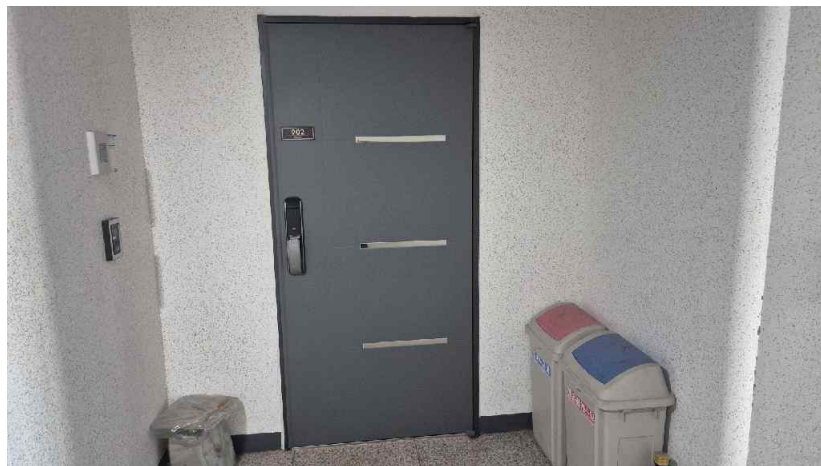
대상물건 내부전경[복도에서 촬영]