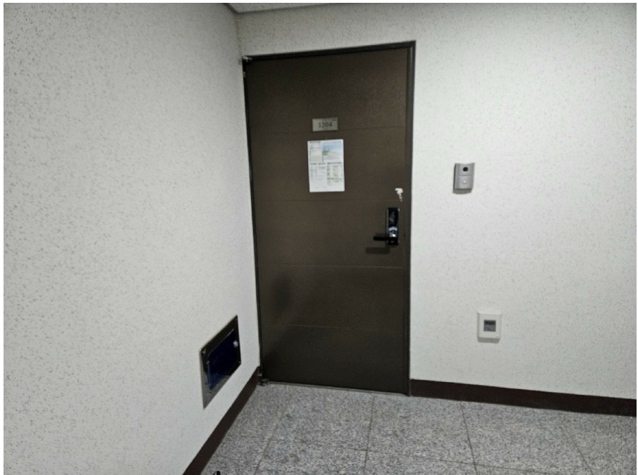
( 1204 )