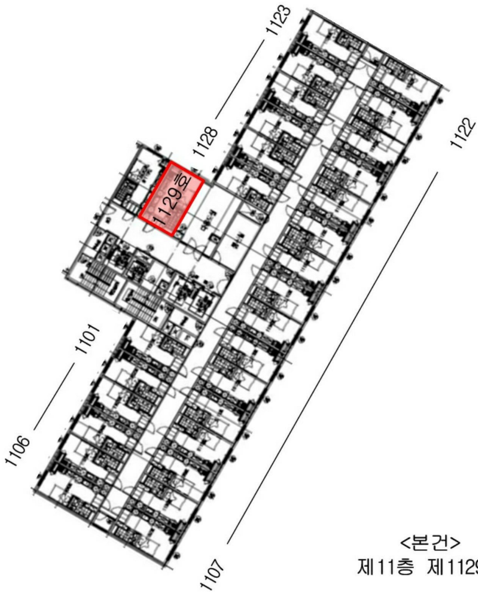
<본건> 제11층 제1129호