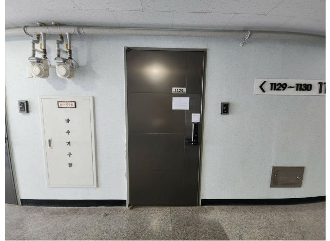
본 건 현 관