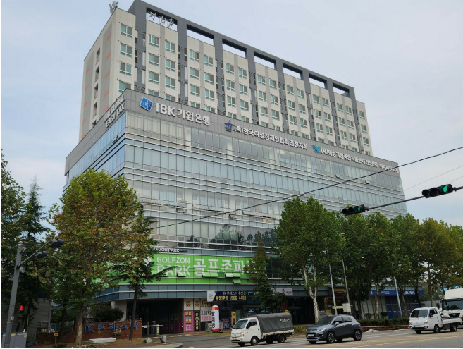
본 건 전 경