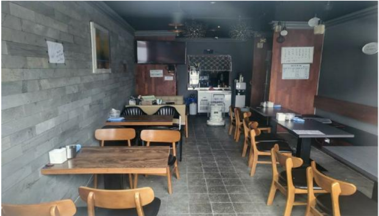
본 건 내 부