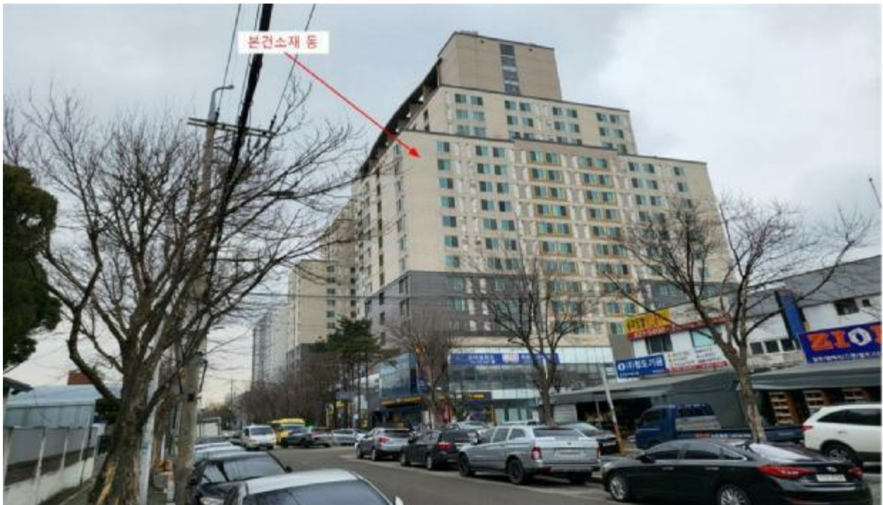
본 건 전 경