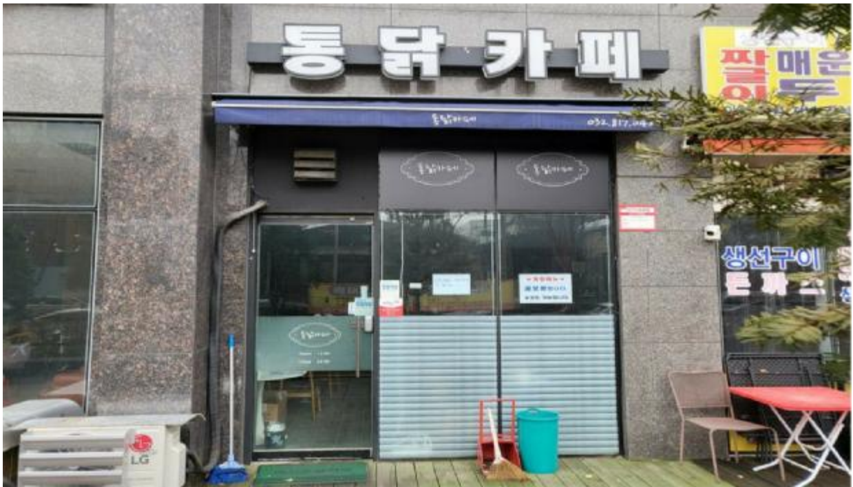
본 건 출입구