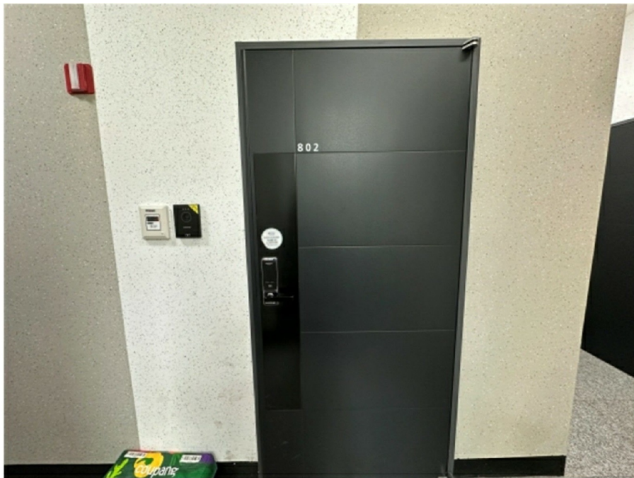
( 802 )