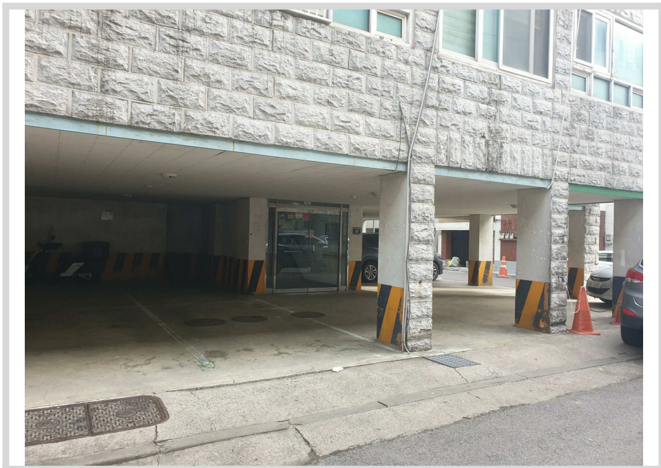
1층 주차, 현관