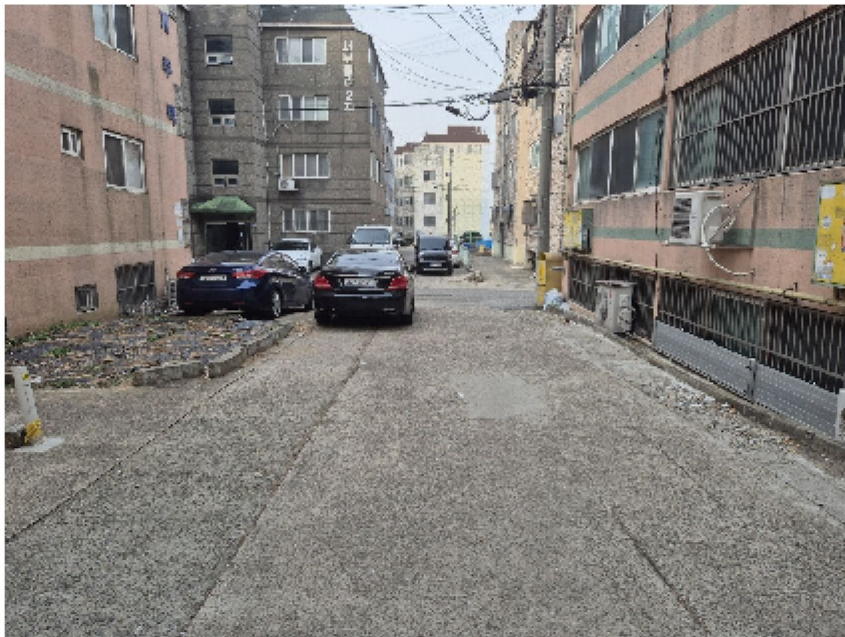
【 대상물건 주위전경[대상물건 북측 진입로 전경] 】