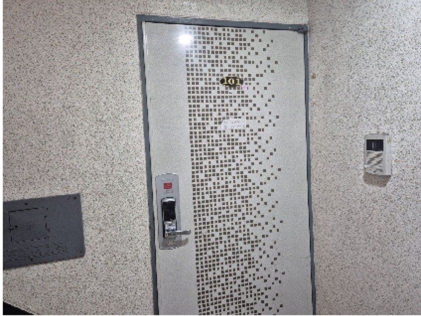
【 대상물건 내부전경2[복도에서 촬영] 】