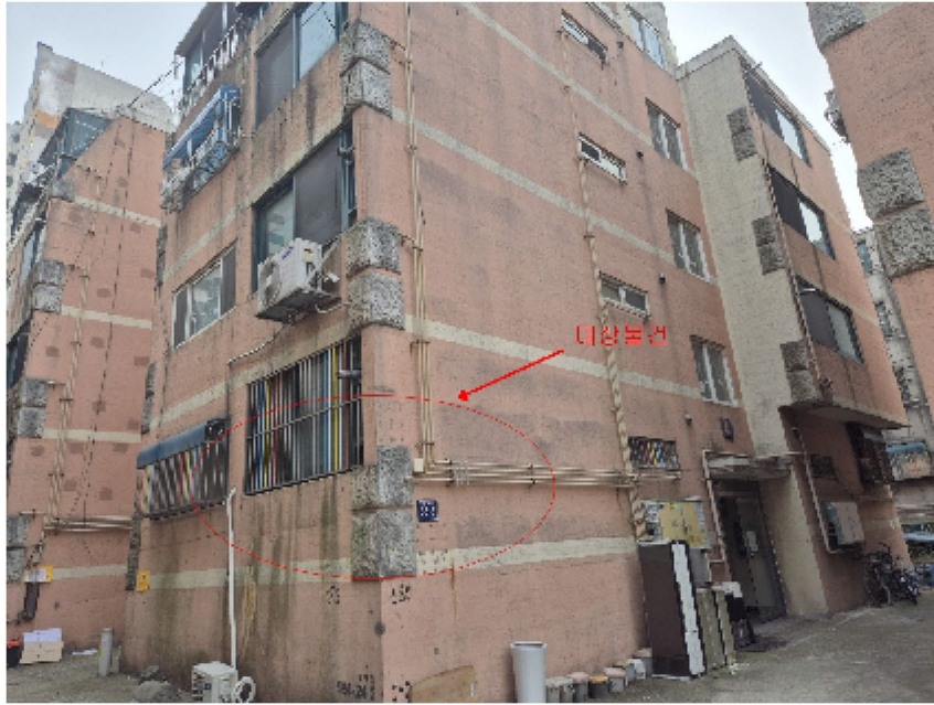
【 대상물건 외부전경1 】