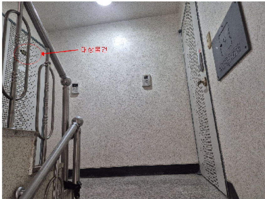
【 대상물건 내부전경1[복도에서 촬영] 】