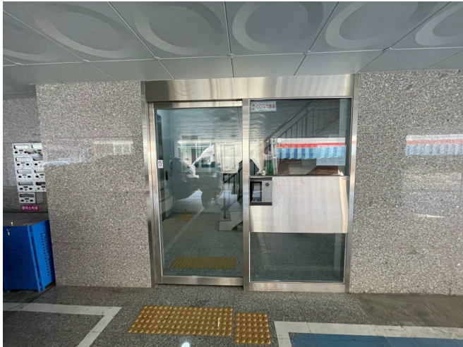
본건물 1층 출입구