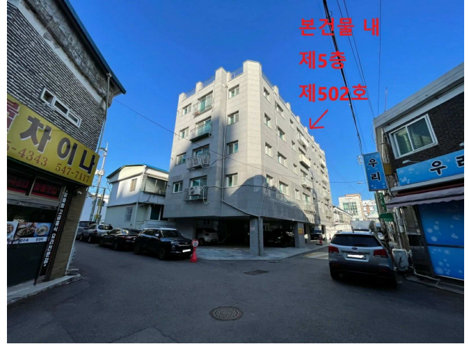
본건물 인근 전경