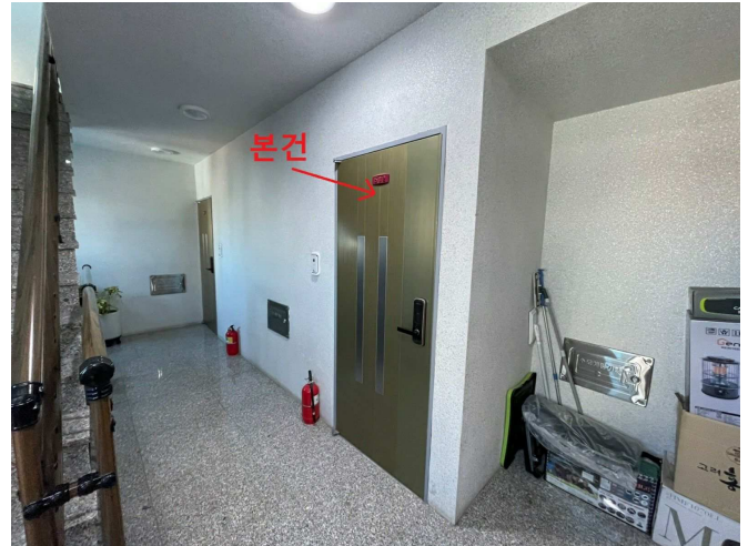
본건 복도 전경