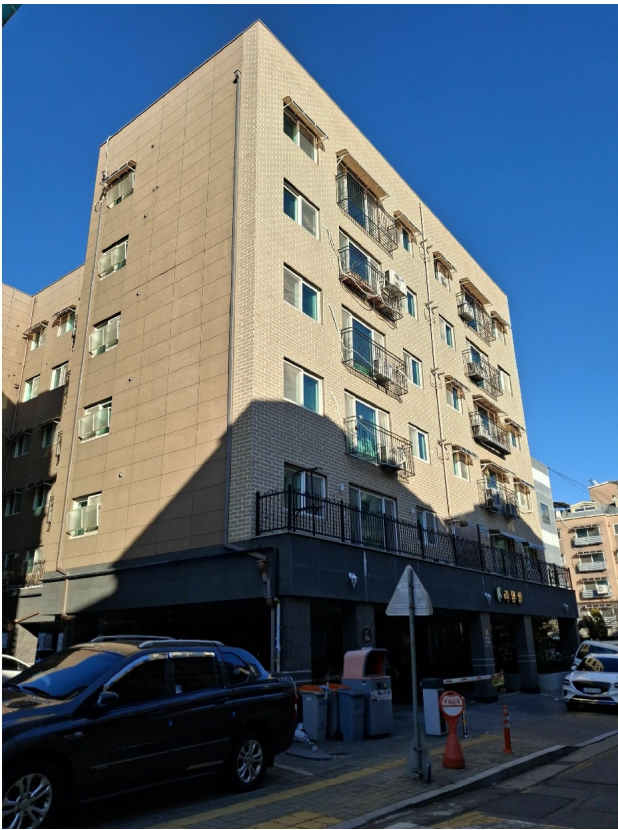
( ) :