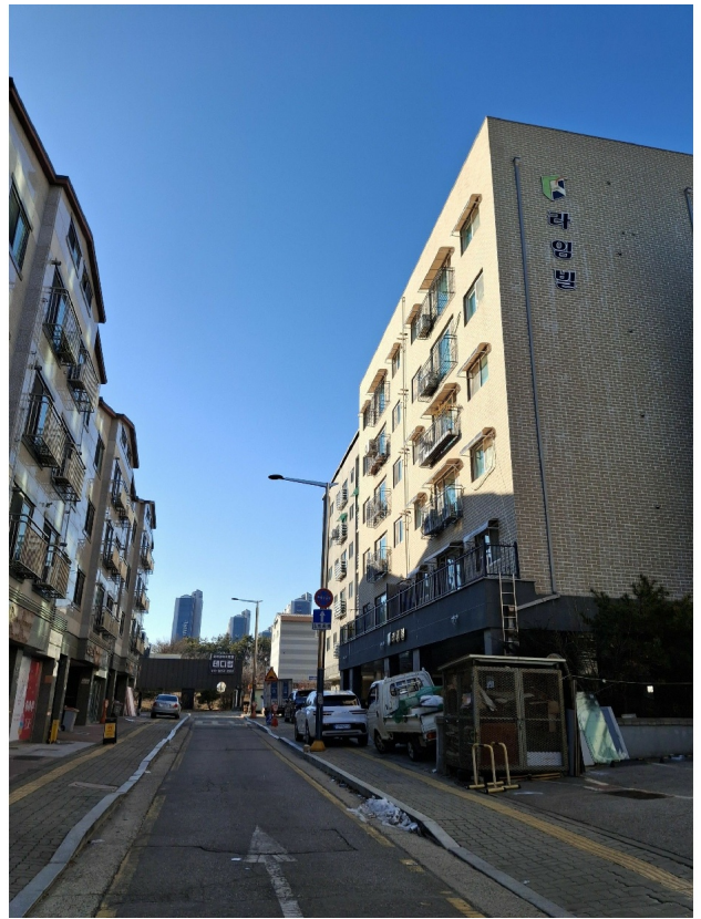
( ) :