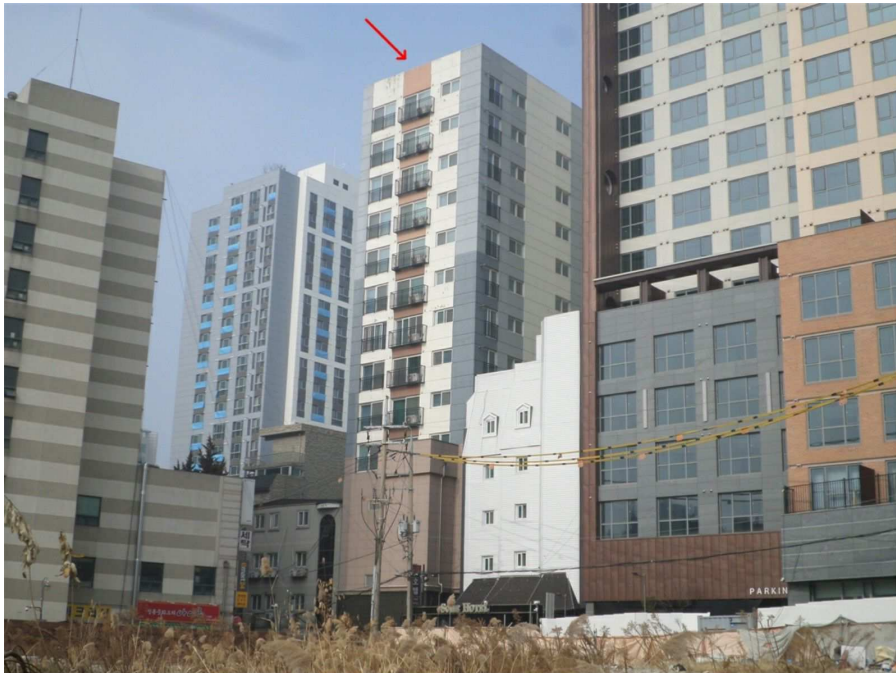
본건이 속한 건물의 전경