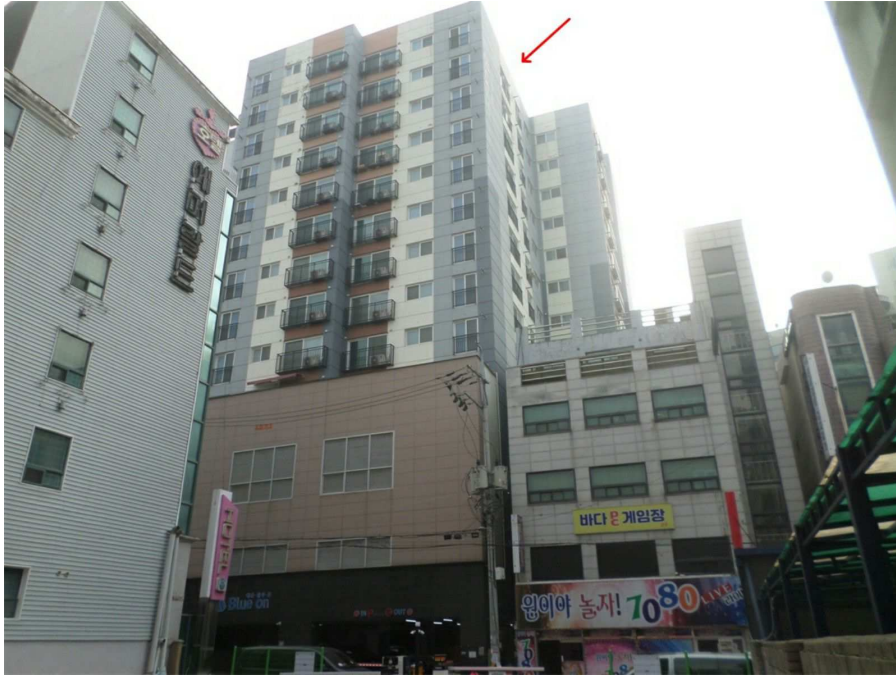
본건이 속한 건물의 전경