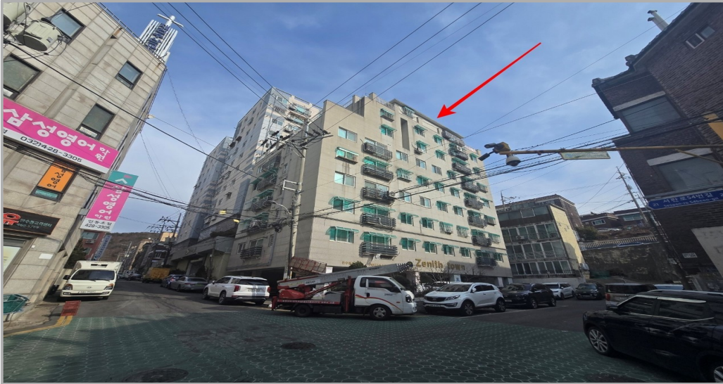
본건 전경 (본건물내 제4층 제402호)