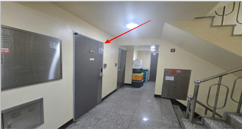
복도에서 출입문 전경