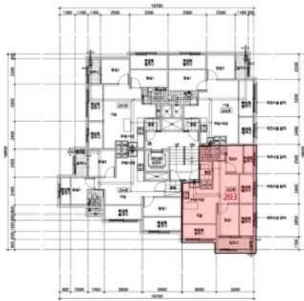
< 2층 호별배치도 >