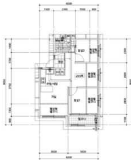
< 203호 내부구조도 >