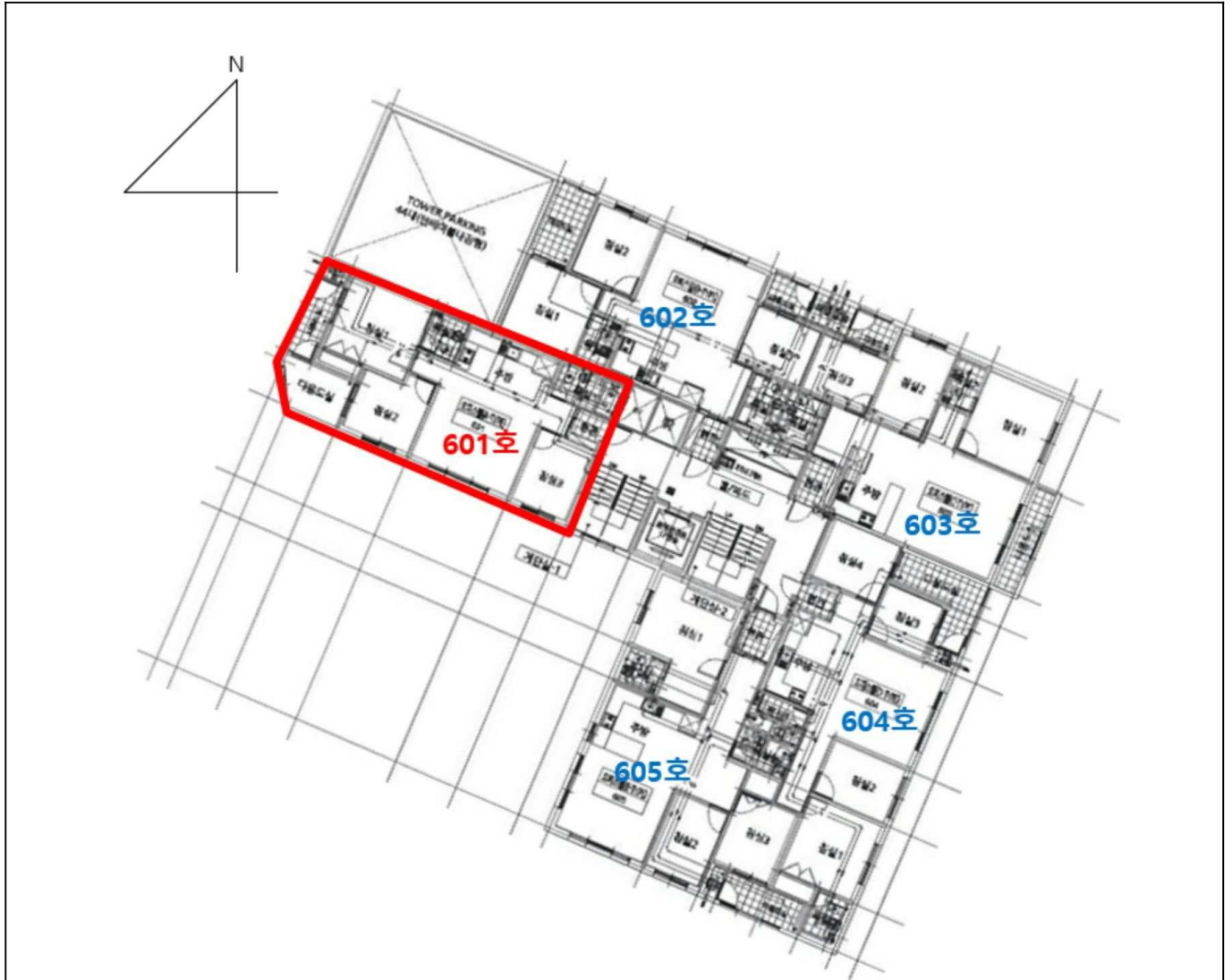
[ 본건 : 위드프라임 제6층 제601호 ]