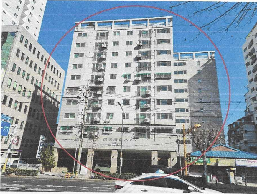
본건이 속한 건물 전경