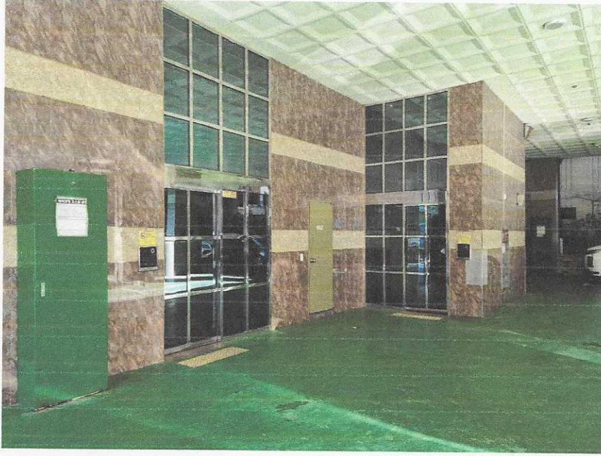
본건 공동 출입문