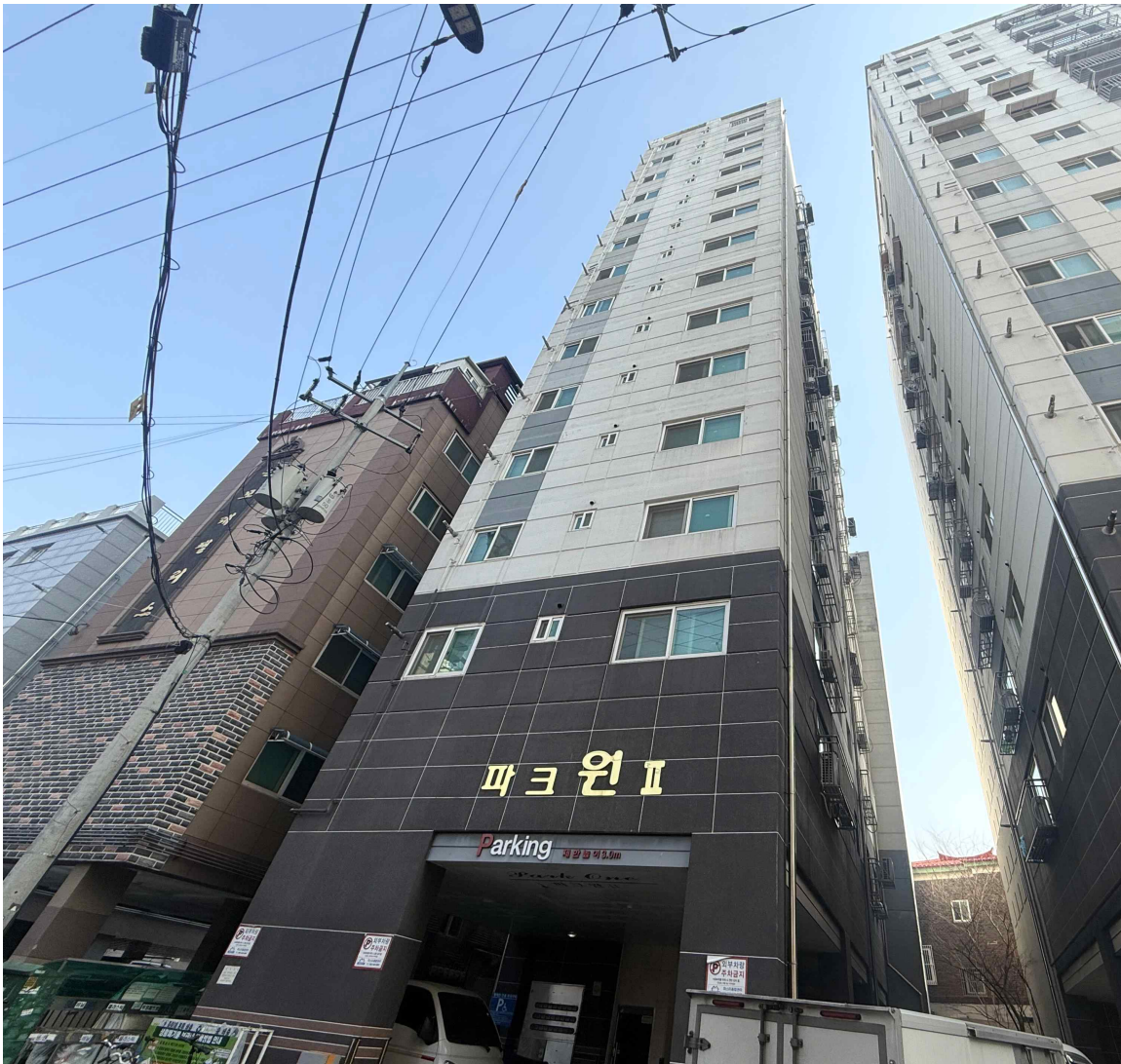
전경 : 『 남측 』 에서 촬영

인천광역시 남동구 만수동 5-230외 파크원26(현황 “파크원 II”) 10층 1001호