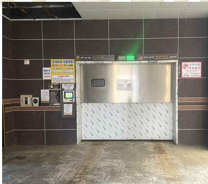
입구전면 및 기계식주차장