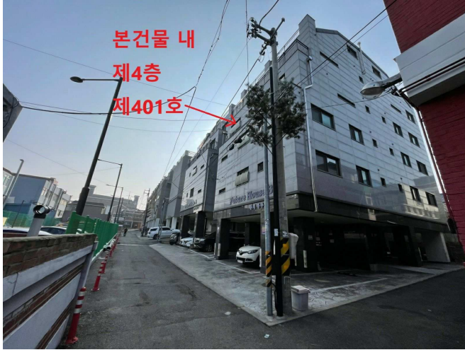
본건물 인근 전경