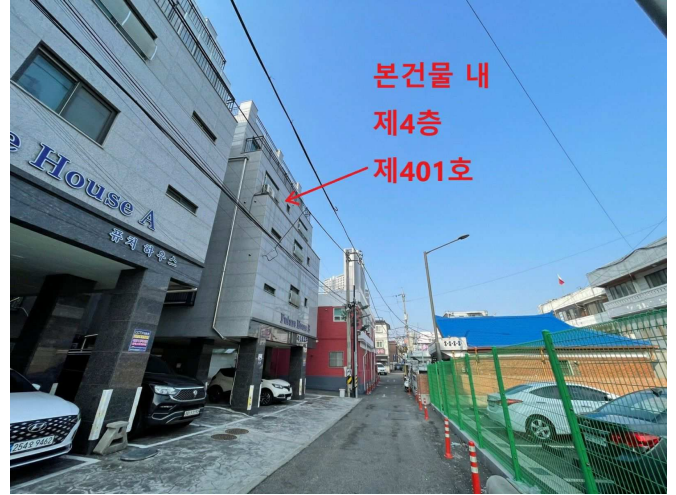
본건물 인근 전경