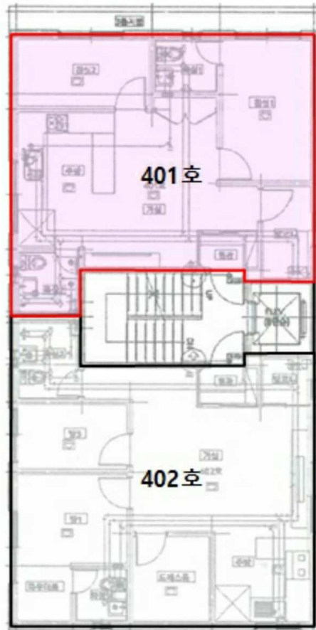
[ 본건 (통칭:퓨처하우스 비동) 제4층 호별배치도 ]

※ 본건 (통칭:퓨처하우스 비동) 제4층 제401호 내부구조도는 미상임.