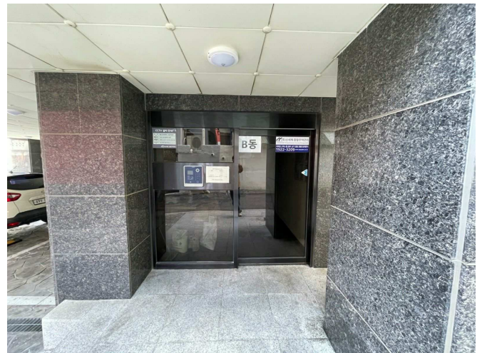
본건물 1층 출입구