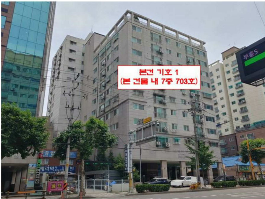
본건 전경(기호 1)