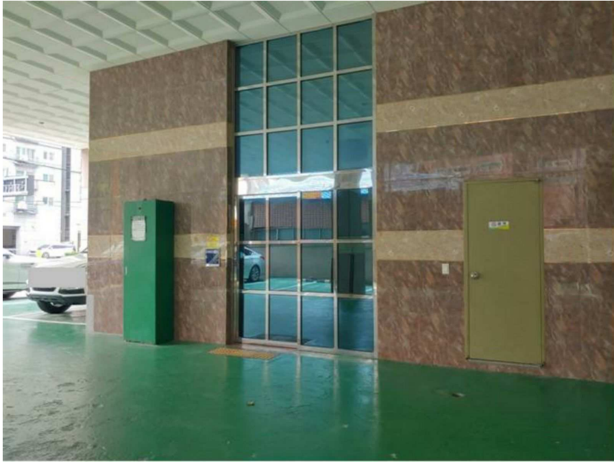
1층 공용출입구 전경