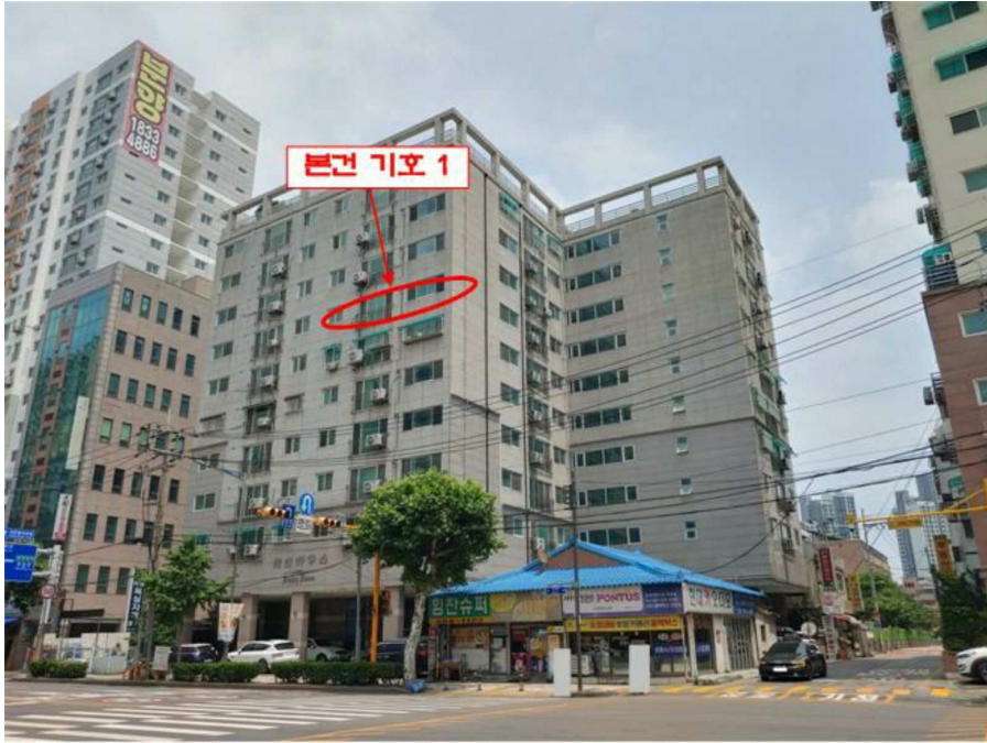
본건 전경(기호 1)