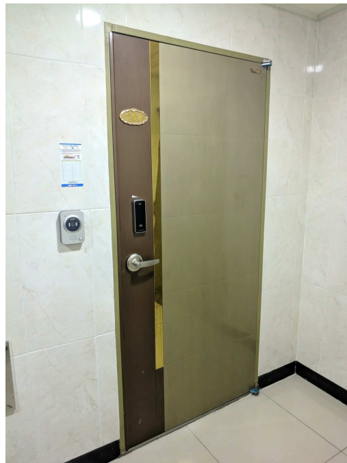
본건 현관 전경