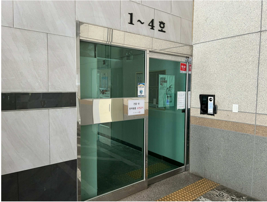
1층 출입부 부분