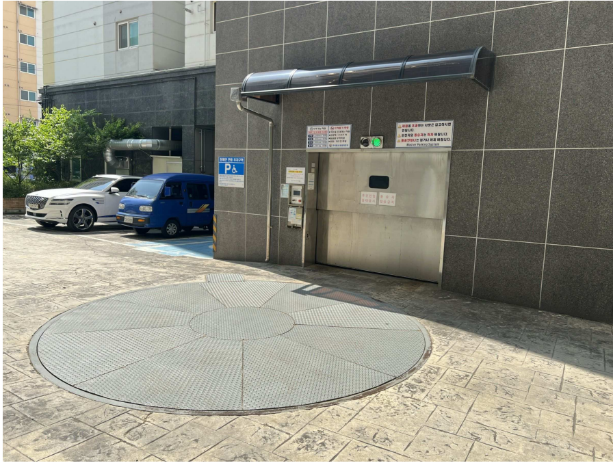
기계식 주차설비 부분