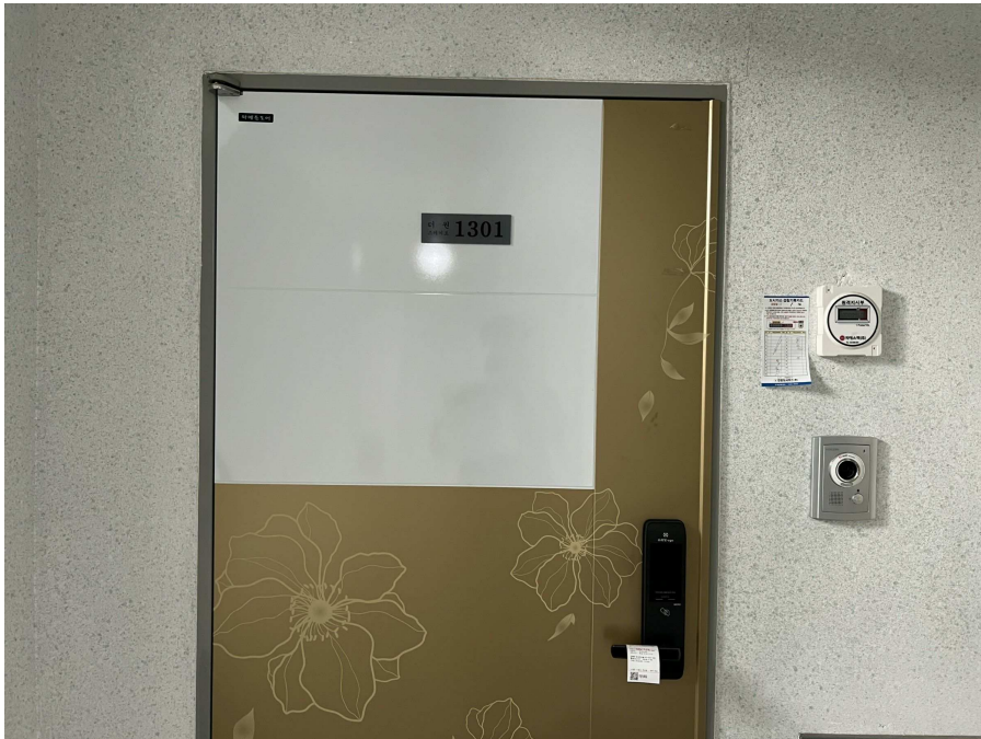
본건 외부 현황