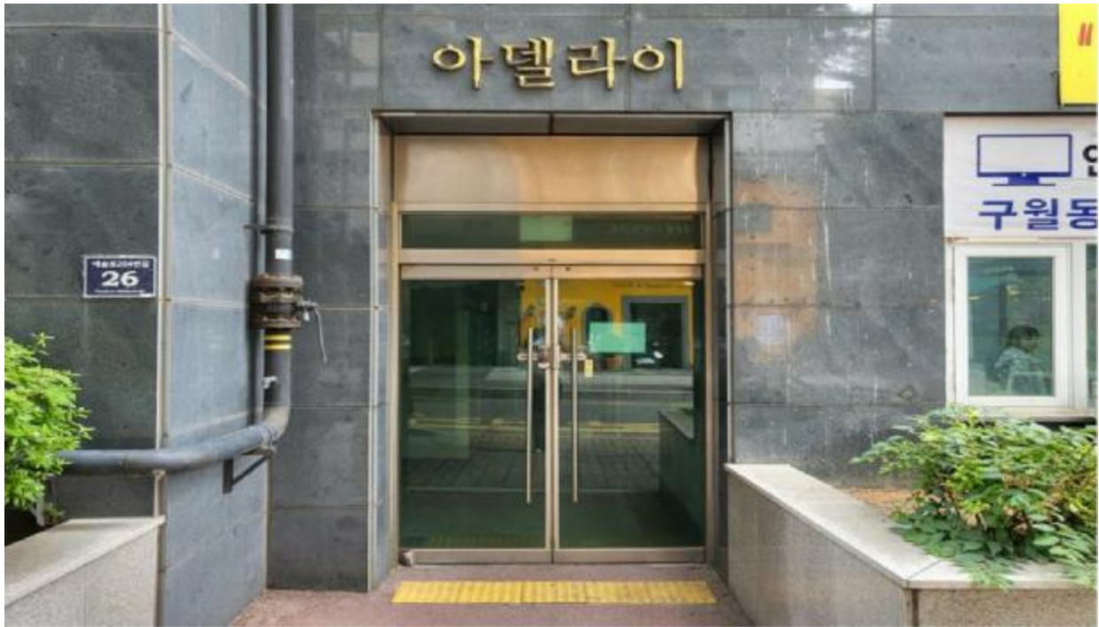
본 건 출입 구(1층)