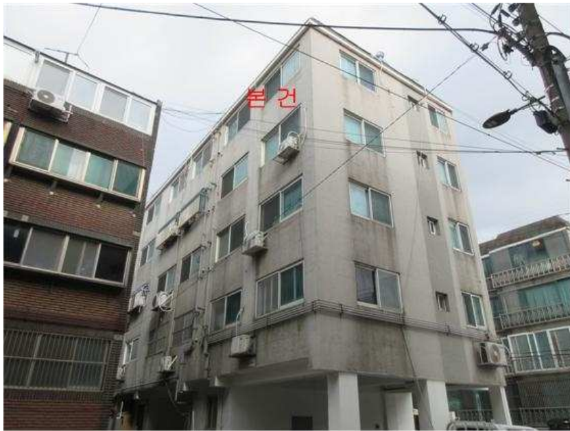
본건 전경 : 본건 [북서측]에서 촬영