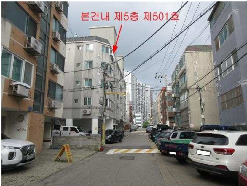
주위환경 : 본건 [남서측]에서 촬영