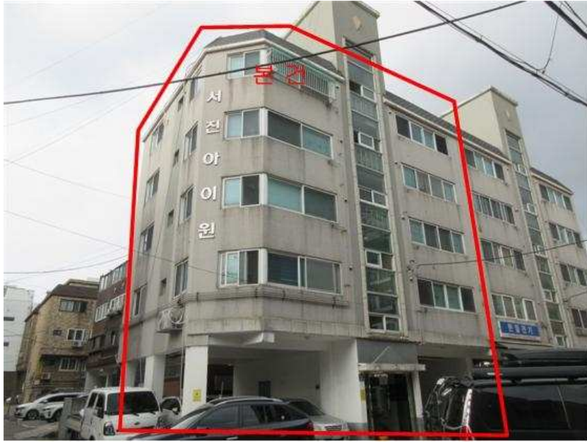
본건 전경 : 본건 [남서측]에서 촬영