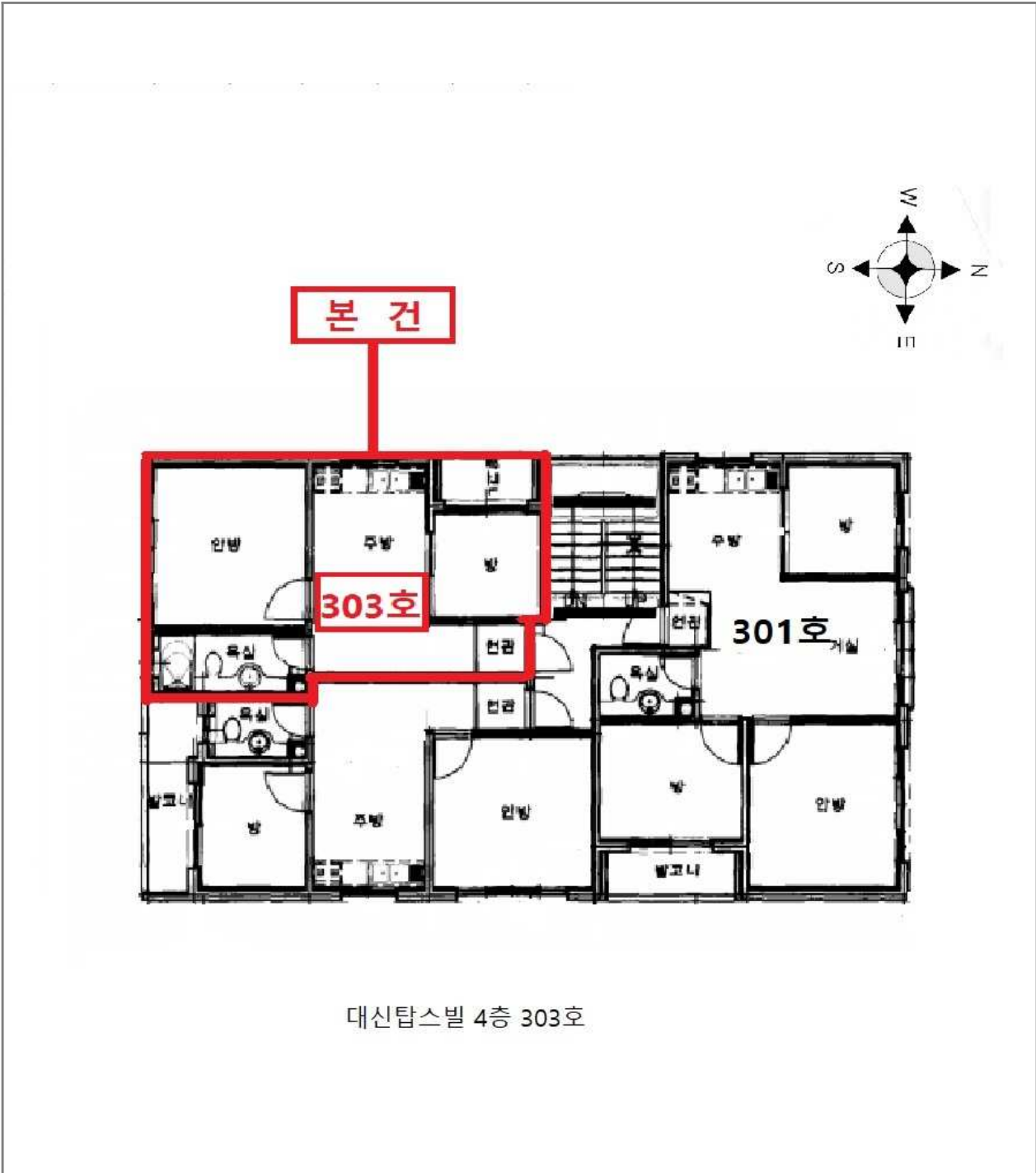
대신탐스빌 4층 303호