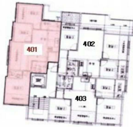
[ 4층 호별배치도 ]