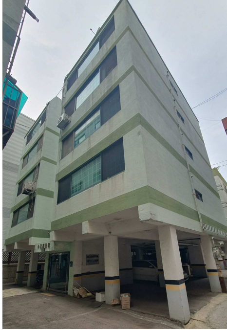
본건 소재 건물 전경