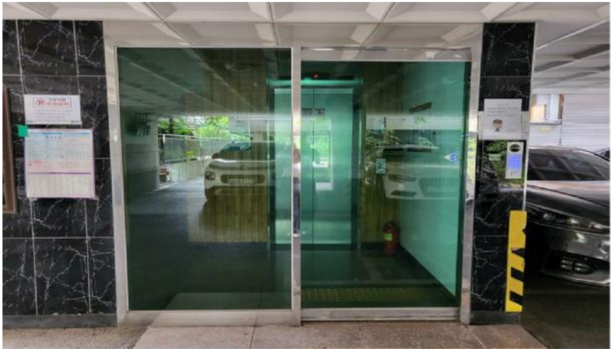
본 건 출입 구(1층)