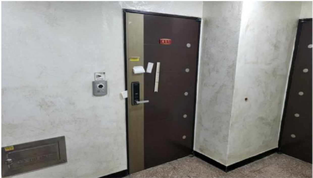
본 건 현 관