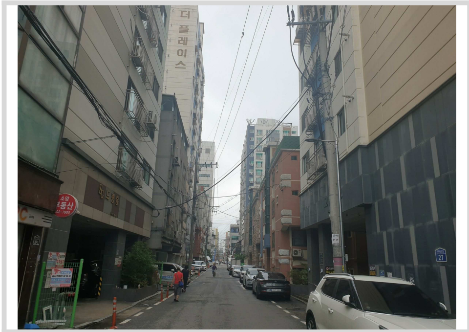
남측 접면 도로