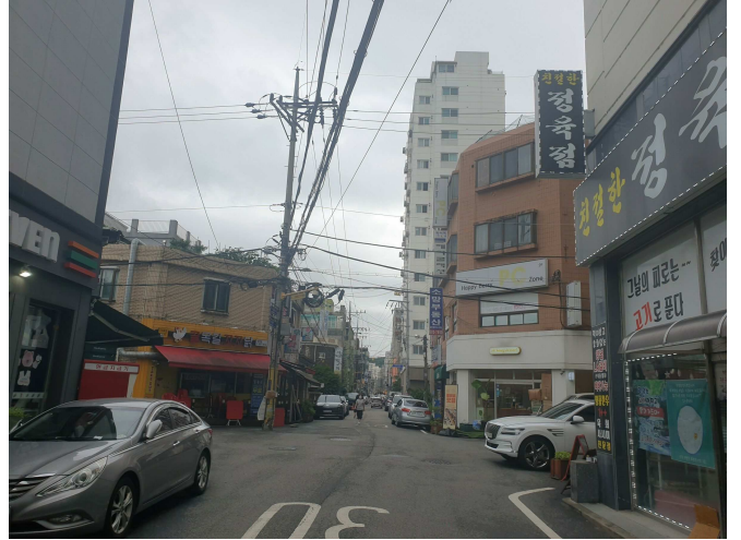
동측 접면 도로