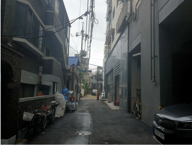
북측 접면 도로