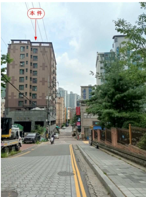
주변 전경(서측 인근에서 촬영)