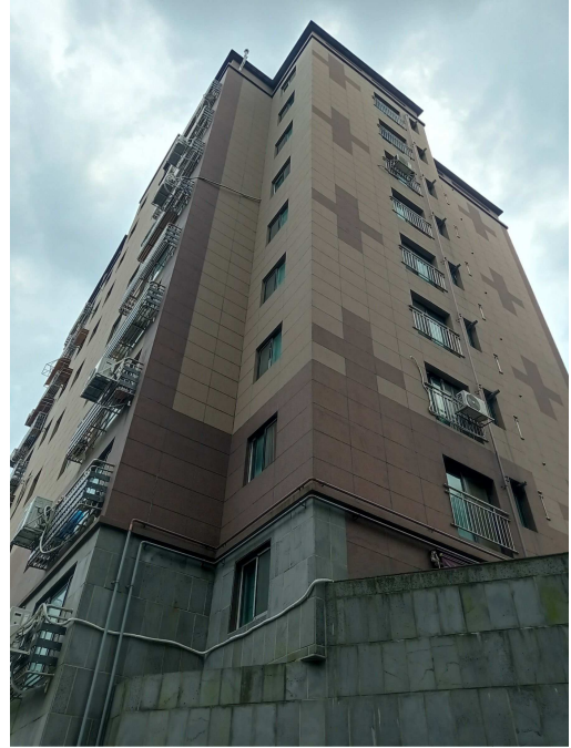
본건 전경2(북서측 인근에서 촬영)