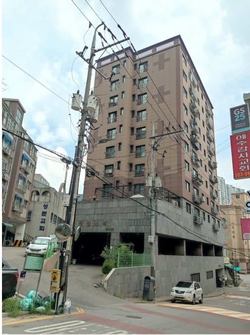
본건 전경1(남서측 인근에서 촬영)