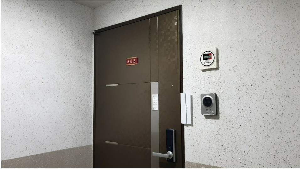
( 802 )