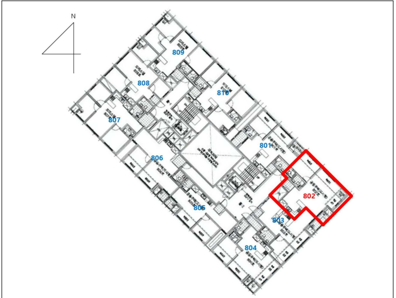
[ 본건 : 노블레스뷰 제8층 제802호 ]